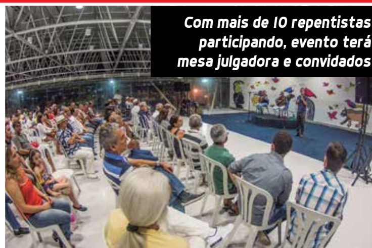
Com mais de 10 repentistas participando, evento terá mesa julgadora e convidados