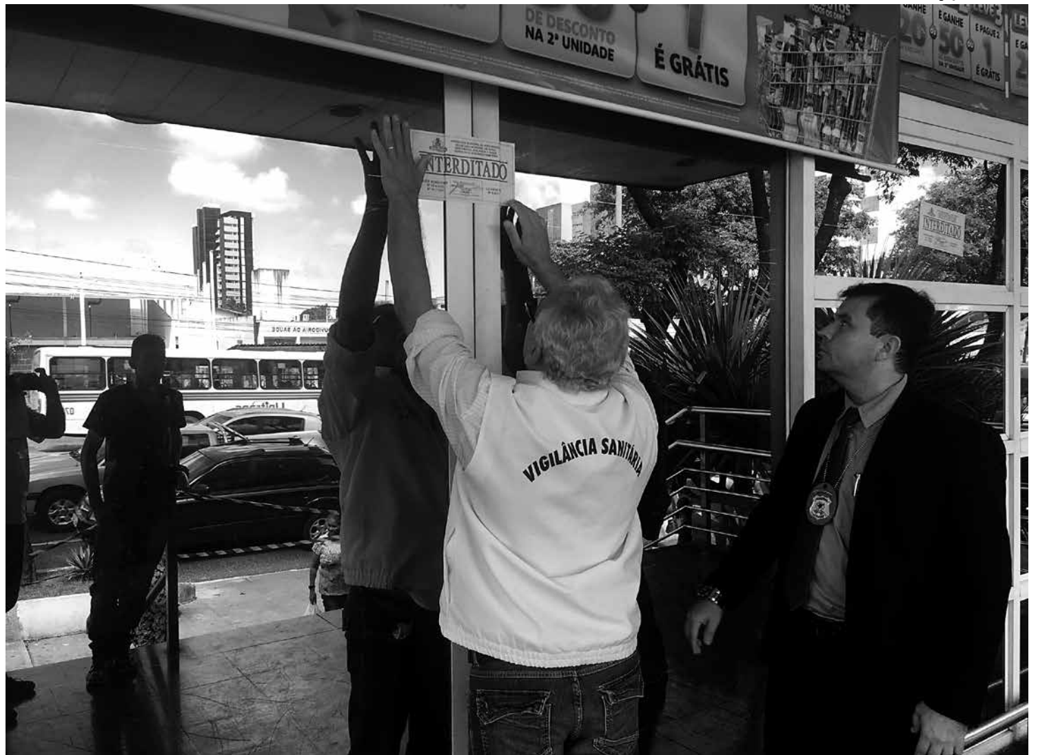
Supermercado, situado na Avenida Epitácio Pessoa, na capital, foi interditado após fiscalização, que contou também com a Polícia Civil

A equipe do MP-Procon também constatou que o estabelecimento estava com o certificado do Corpo de Bombeiros vencido, mas foi apresentado, por parte da empresa, um comprovante de requerimento de renovação do certificado feito junto