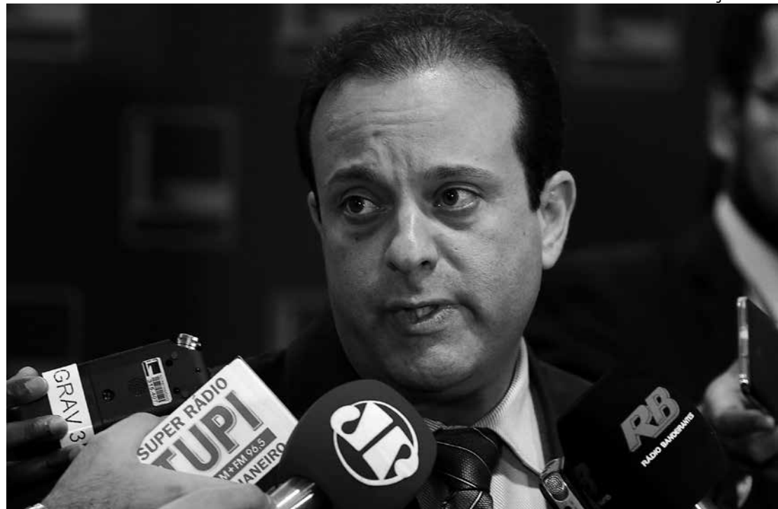
Deputado André defende esforço concentrado na próxima semana para acelerar as votações