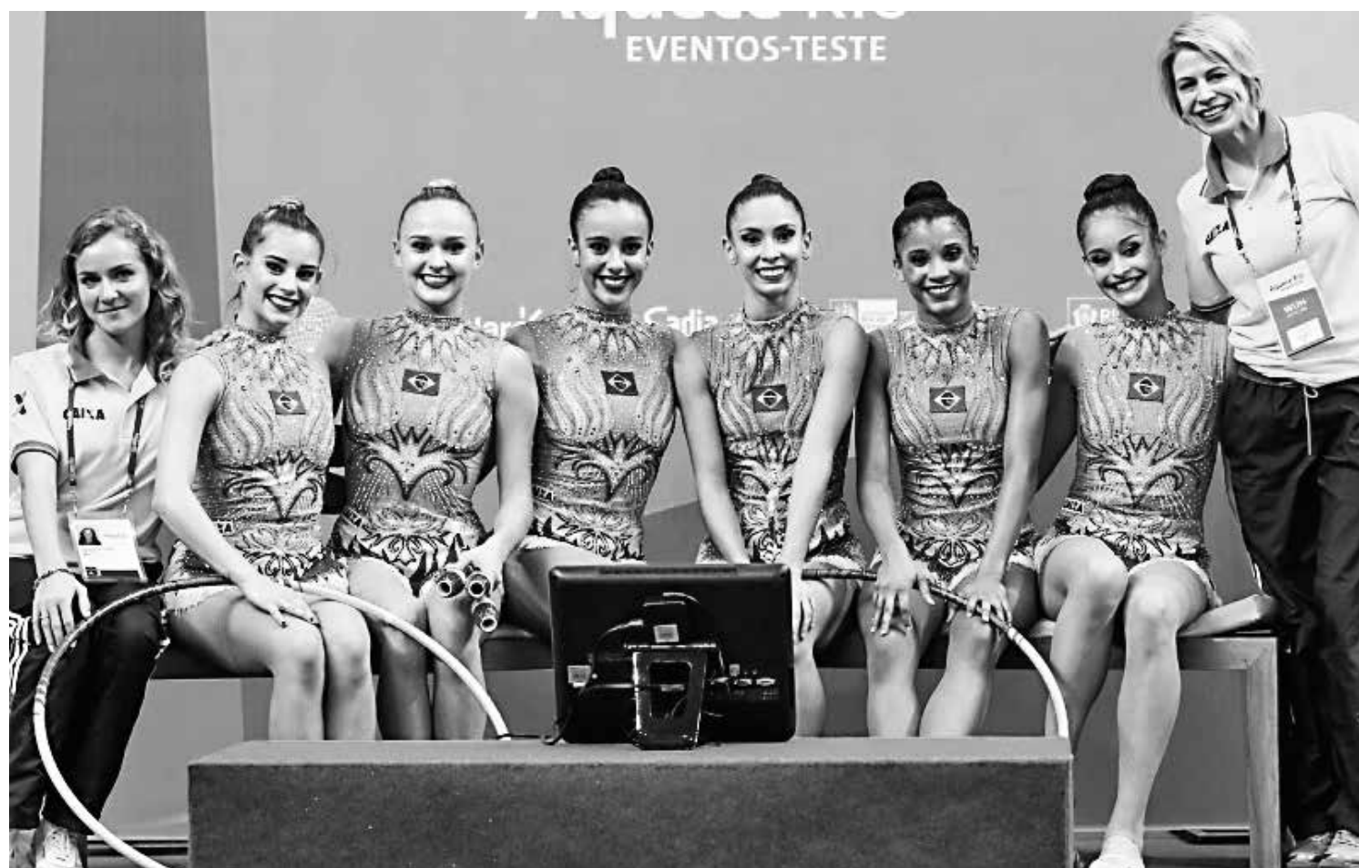
As atletas ficaram em quarto e quinto lugares e não chegaram ao pódio, no entanto os resultados foram considerados positivos

A Seleção Brasileira agora deixa a Alemanha e embarca para a Rússia, onde disputará a Copa do Mundo de Kazan, no próximo fim de semana.