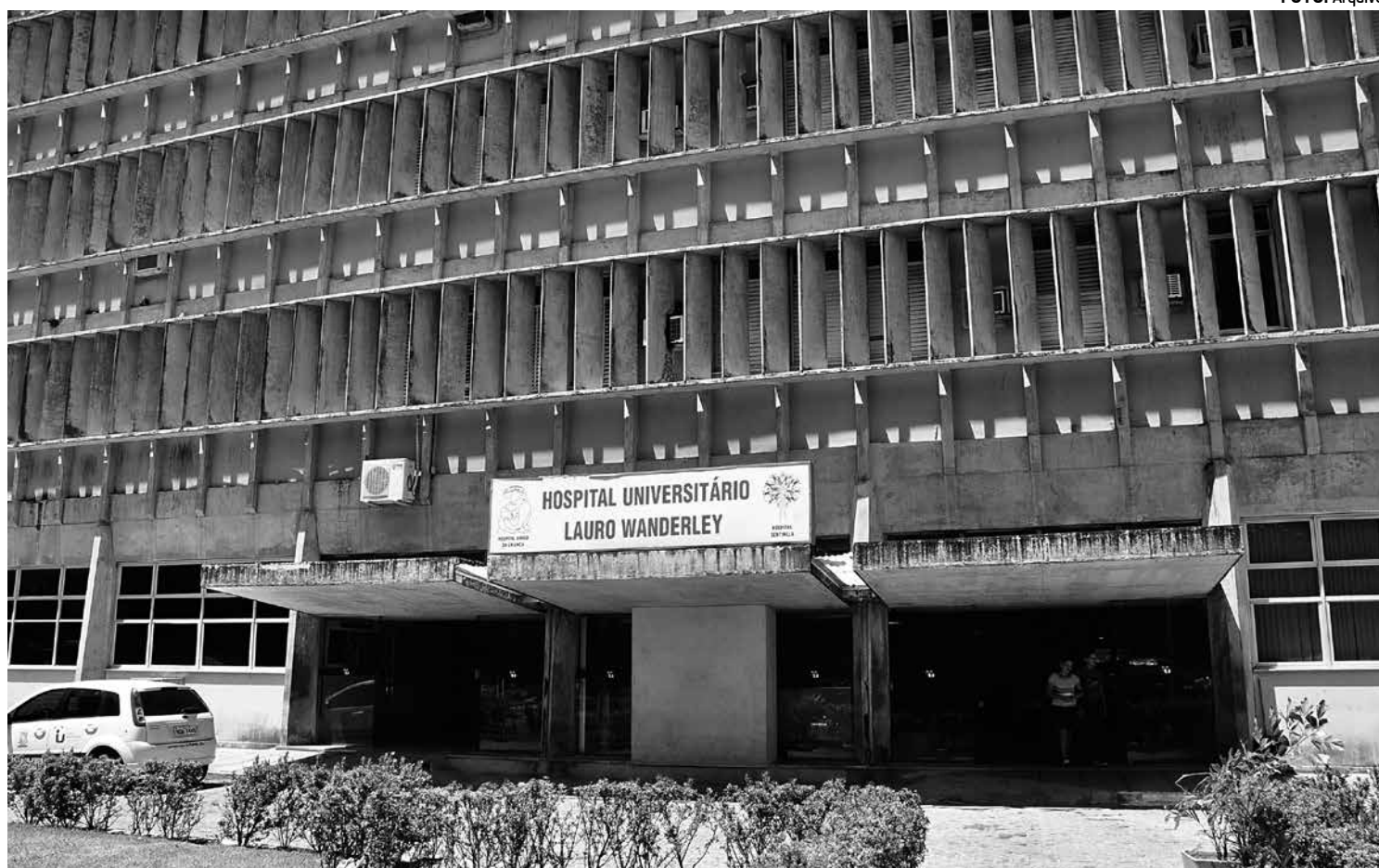
Hospital Lauro Wanderley recebeu recursos da ordem de R$ 200.655,31; e o Alcides Carneiro, em Campina Grande, ficou com R$ 382.832,47

Os recursos federais foram liberados por meio do Programa Nacional de Reestruturação dos Hospitais Universitários Federais (REHUF). Desenvolvido desde 2010 em parceria com o Ministério da Educação e a Empresa Brasileira de Serviços Hospitalares (EB-SERH), o REHUF já possibilitou investimento de aproximadamente R$ 3 bilhões nos hospitais universitários, somente por parte do Ministério da Saúde. Com isso, as universidades mantenedoras desses estabelecimentos ganham maior capacidade