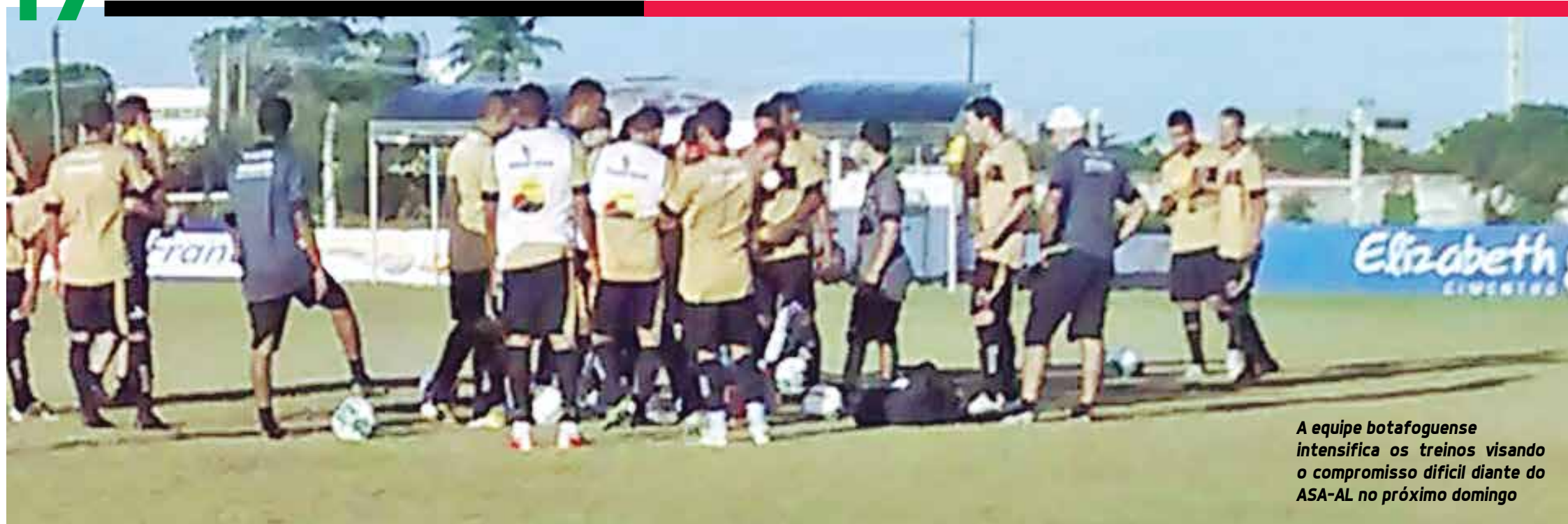
A equipe botafoguense intensifica os treinos visando o compromisso difícil diante do ASA-AL no próximo domingo