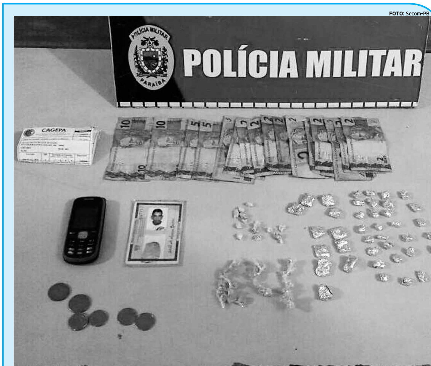
Em uma casa abandonada no bairro Nova Brasília, a polícia encontrou 40 pedras de crack, 40 papelotes de maconha e dinheiro

As duas mulheres presas foram encaminhadas à Central de Polícia Civil no bairro do Geisel, de onde seguem para audiência de custódia. Já o adolescente foi conduzido para a Delegacia de Bayeux para realização de procedimento de ato infracional.