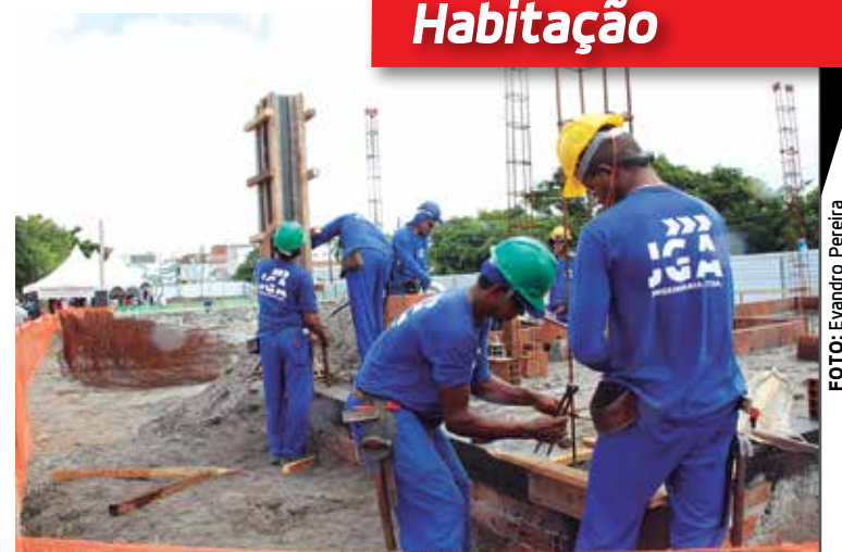
Serão construídos dois blocos com 32 apartamentos cada