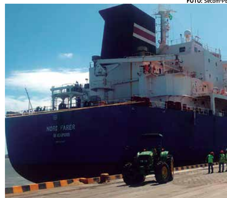
Petroleiro Nord Farer trouxe ontem 14 mil toneladas de gasolina

O presidente do SCV informou que o estoque de combustível fora do custo é terminantemente proibido por lei, além de ser crime contra ordem econômica previsto no código penal. "Você não pode levar um vasilhame para estocar gasolina, por exemplo, isso é contra a lei", finalizou.