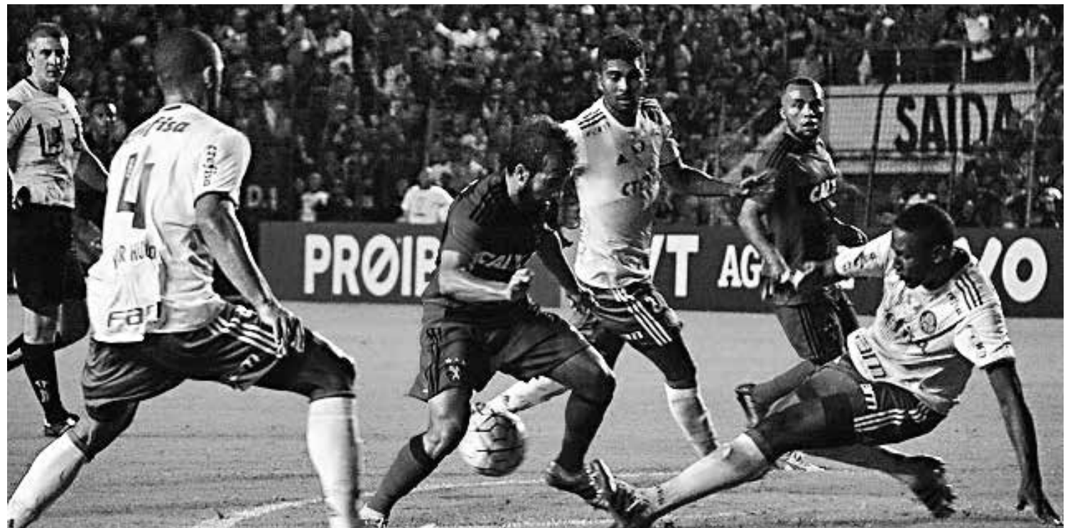
Na noite da última segunda-feira, o Verdão foi até Recife e não encontrou dificuldade para vencer o Sport-PE por 3 a 1 em jogo isolado

Completando a rodada de abertura da terceira fase da Copa do Brasil 2016, estarão se enfrentando Figueirense-SC x Sampaio Corrêa-MA, às 19h30, no Orlando Scarpelli e Paysandu-PA x Operário-PR, no Estádio Curuzu, em Belém do Pará.