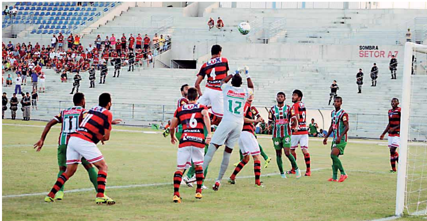
O Rubro-Negro paraibano está motivado depois de vitória sobre o Fluminense-BA, e ainda acredita na classificação à fase seguinte