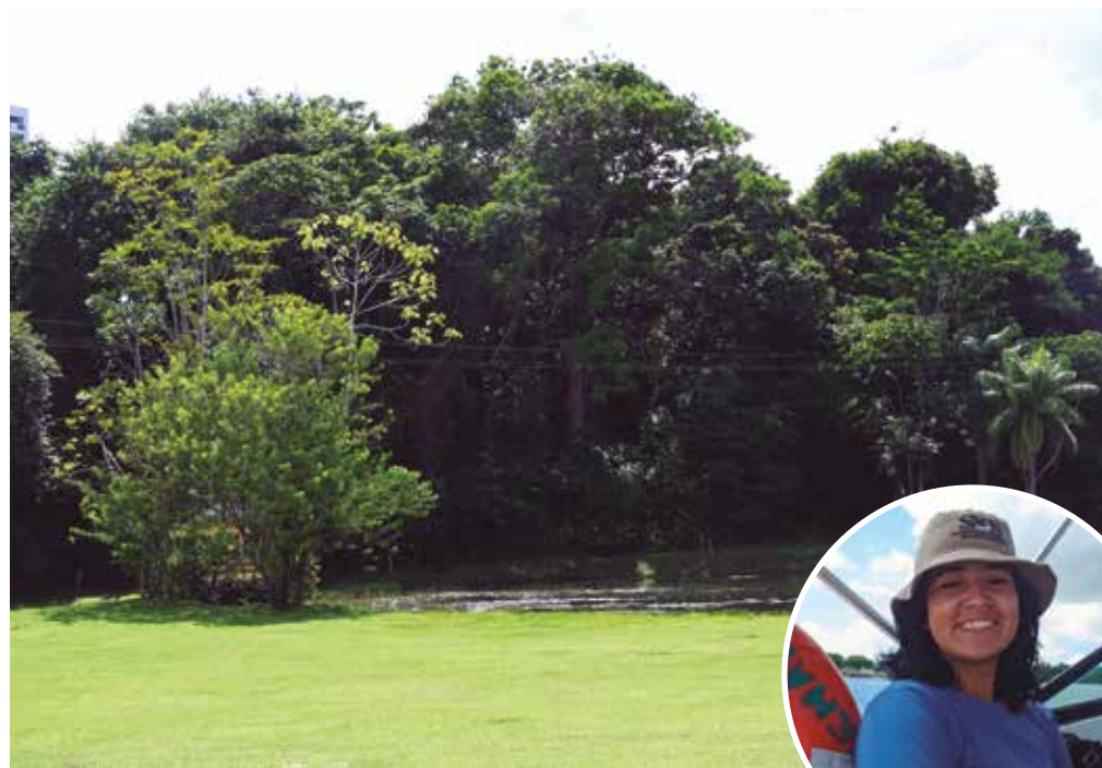
Áreas como o Jardim Botânico ajudam a preservar espécies