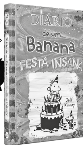
O protagonista Greg só quer comemorar seu aniversário, mas tudo vira um caos