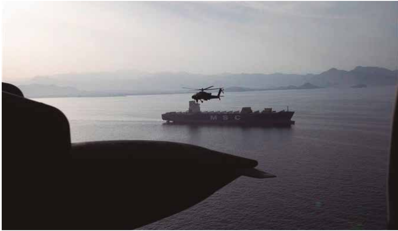
Estreito de Ormuz, fechado pelos persas desde o primeiro ataque estadunidense, agora também tem bloqueio dos EUA

A via navegável facilita a passagem de cerca de um quinto das exportações mundiais de petróleo, gás e outros produtos cruciais, como fertilizantes. O petróleo bruto Brent, referência internacional, era negociado a pouco mais de US$ 95 por barril ontem, queda acentuada em relação aos quase US$ 120 registrados antes da trégua, mas ainda assim uma alta de aproximadamente 40% frente aos preços do início de fevereiro.