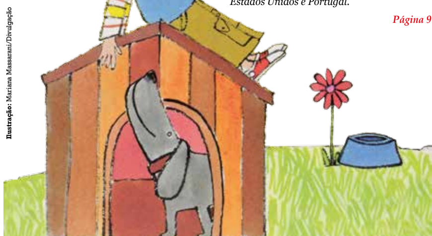
Ilustração: Mariana Miasami/Divulgação