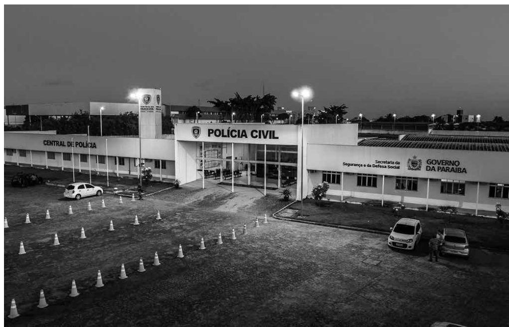
Presos em ações da polícia foram encaminhados para a Cidade de Polícia, no bairro do Geisel

Após a prisão, os suspeitos foram levados para a Cidade de Polícia, onde aguardaram pela audiência de custódia.