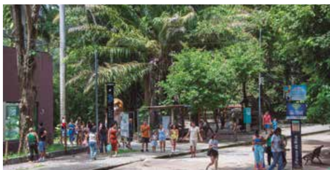
Parque ficou cheio, ontem, apesar da manhã nublada, na capital

Para os pais, a Bica é uma oportunidade de trabalhar a educação ambiental com os fi-