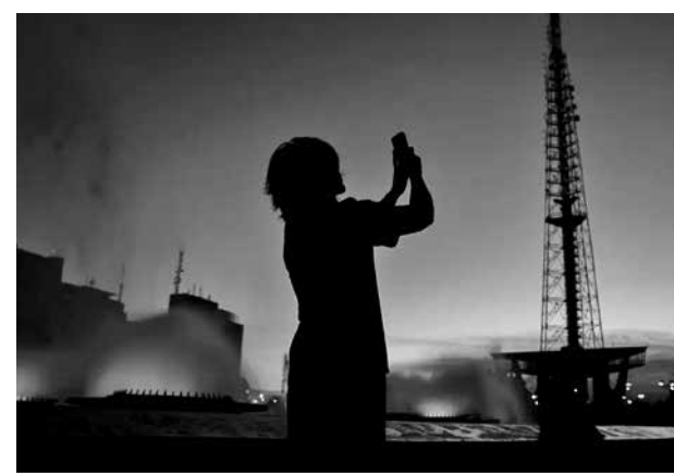
Torre de TV da capital federal, um ponto turístico

“O terreno, que é o corpo, é essa parte da engenharia da peça. Porque Brasília, para mim, não é apenas essa arquitetura. Ela é quase mítica”.