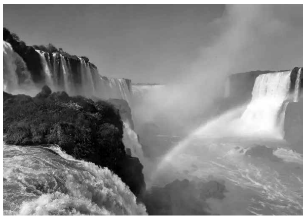
Parque Nacional do Iguaçu é uma área protegida brasileira