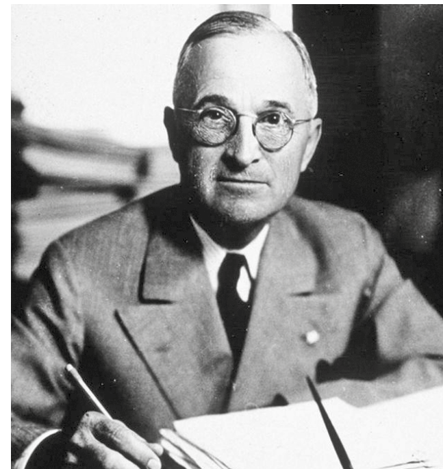
Harry Truman, presidente dos EUA no fim da 2ª Guerra