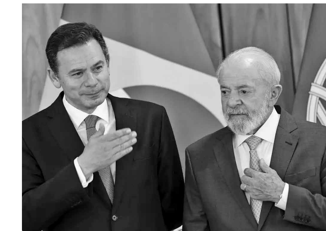
Encontro entre os dois líderes também abordou o acordo do Mercosul com a União Europeia

“Se não defendermos e valorizarmos a língua portuguesa, ninguém vai. É algo que deve vir de nós”,