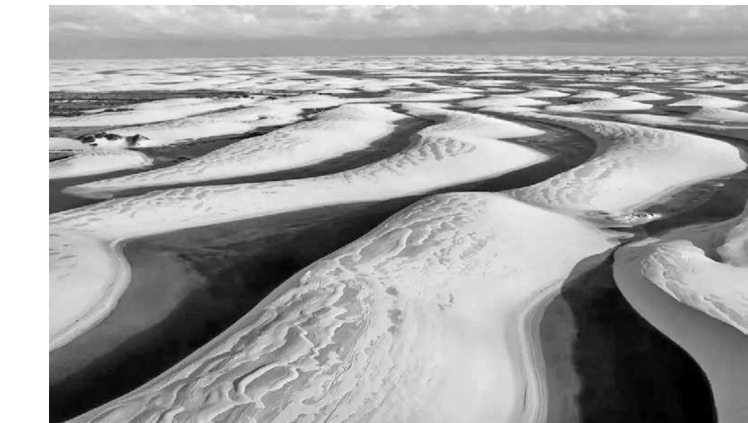
Lençóis maranhenses são um expoente dos ecossistemas de mangue, restinga e dunas no NE

O relatório deixa claro que mais de um em cada quatro sítios da Unesco poderá atingir pontos críticos de ruptu-