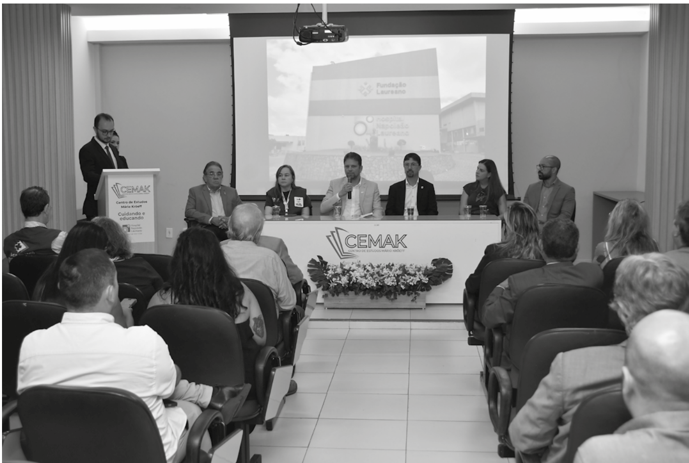
Representantes do Ministério da Saúde e da SES participaram de solenidade que marcou, ontem, a retomada do procedimento