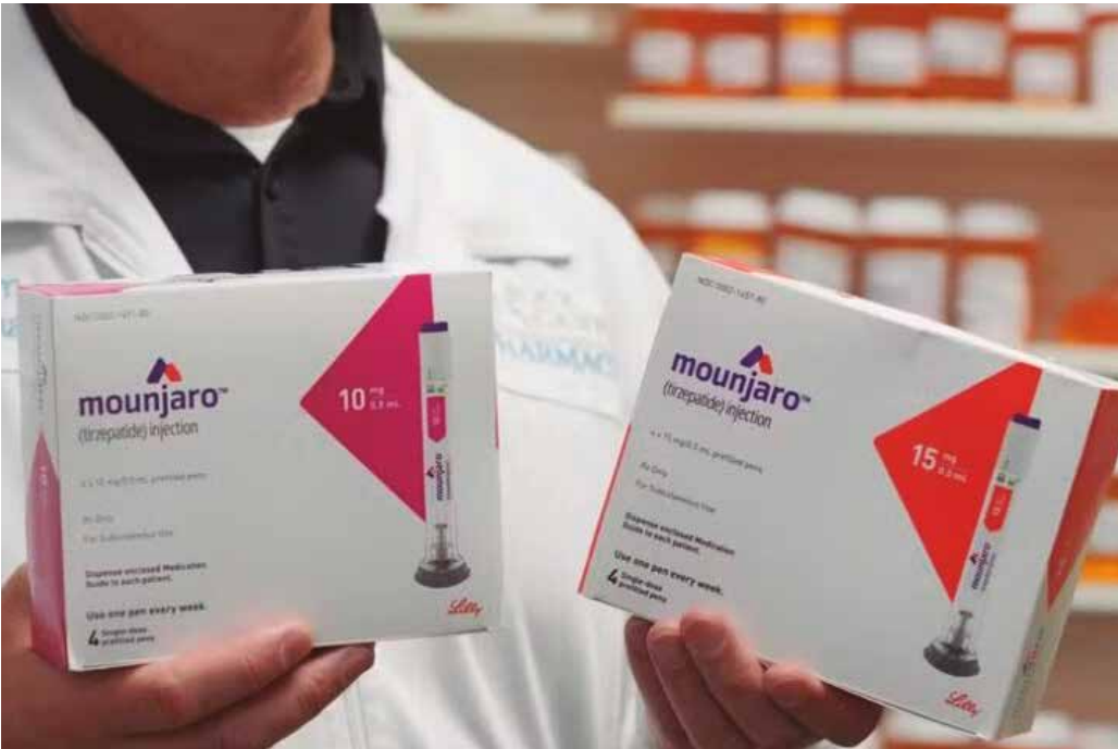
Ambos são medicamentos agonistas do receptor GLP-1, conhecidos como “canetas emagrecedoras”

aprovados no Brasil, as notificações têm aumentado tanto no cenário internacional quanto no cenário nacional, o que exige reforço das orientações de segurança. O monitoramento médico, segundo a agência, é motivado pelo risco de eventos adversos graves, incluindo pancreatite aguda, que podem incluir formas necrotizantes e fatais. No início do mês, a Agência Reguladora de Medicamentos e Produtos de Saúde (MHRA) do Reino Unido também emitiu alerta para o risco, ainda que pequeno, de casos de pancreatite aguda grave em pacientes que utilizam canetas emagrecedoras.