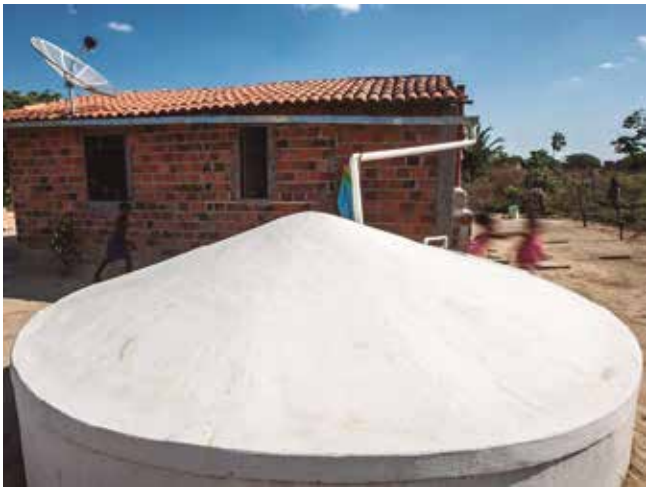
No Brasil, foram entregues mais de 104 mil unidades

■ Paraíba recebeu mais de 8,2 mil unidades de 2023 a 2025, ampliando o acesso à água para famílias, escolas e produção rural