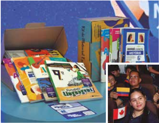
Secretaria apresentou kit escolar e novos destinos do Conexão Mundo