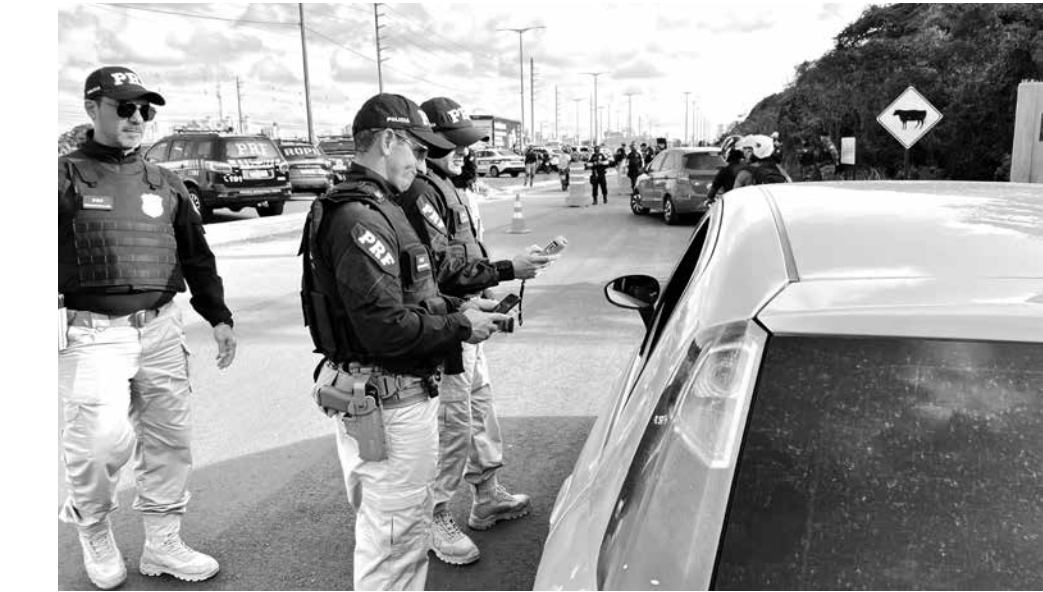
Fiscalizações e campanhas educativas foram intensificadas para o período de Carnaval

Por outro lado, os dados locais mais recentes, do início deste ano, revelam uma melhora nesses índices: ao comparar janeiro de 2026 com o