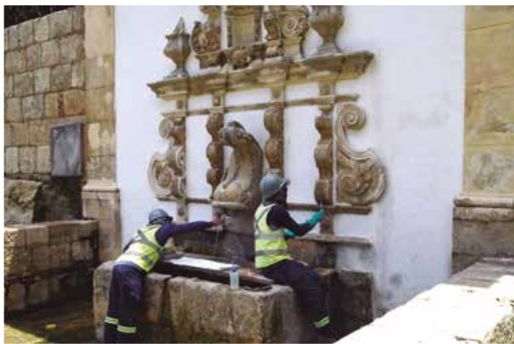
Antes foram reformados a fachada e os azulejos da Via Sacra

As reformas integram o projeto Caminhos da Fé — Educação Patrimonial ao Ar Livre, que propõe um circuito pelas igrejas coloniais do Centro Histórico, como a Catedral Basílica Nossa Senhora das Neves e as Igrejas do Carmo, da Nossa Misericórdia e de São Frei Pedro Gonçalves. Além do Centro Cultural São Francisco, o Mosteiro de São Bento também está recebendo intervenções na fachada, depois de uma reforma no telhado. “Embora os telhados não tenham tanto destaque, eles são fundamentais porque