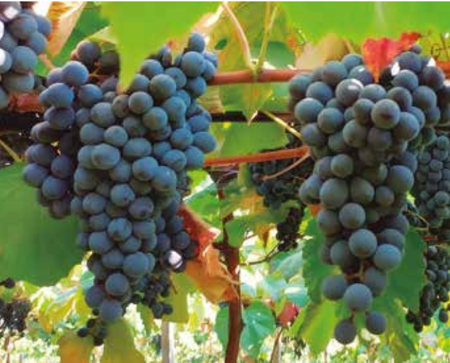
Antonella tem ciclo intermediário e se adapta bem à Serra Gaúcha

lizadas para processamento, como Isabel e Concord. Esses compostos são diretamente responsáveis pela intensidade de cor, pela estrutura sensorial dos sucos e vinhos e pelo potencial antioxidante dos produtos. Nos estudos conduzidos pela Embrapa, os índices de polifenóis totais (IPT) dos sucos e vinhos elaborados com BRS Lis foram equivalentes ou superiores aos da cultivar Bordô e significativamente maiores do que os observados em Isabel e Concord. A BRS Antonella, por sua vez, também apresentou elevados teores de antocianinas, contribuindo de forma consistente para a intensificação da coloração em cortes industriais. “Essa maior concentração de polifenóis e taninos confere aos produtos finais maior estabilidade de cor, melhor resistência à oxidação e maior valor tecnológico, elevando o padrão visual e sensorial dos sucos e vinhos”, explica Zanús. Impacto produtivo Na tomada de decisão sobre qual cultivar plantar, a avaliação prévia da demanda da vinícola à qual a produção será destinada é fundamental para o viticultor. Nesse contexto, tanto a BRS Lis quanto a BRS Antonella apresentam vantagens comparativas relevantes para o sistema produtivo.