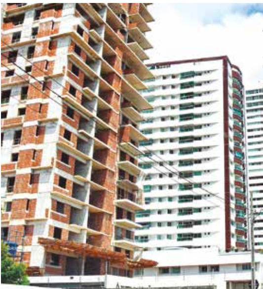
Preço médio do metro quadrado ficou em R$ 1.867

Insumos mais baratos Já o custo do material apresentou uma ligeira queda, passando de R$ 1.096,95 em dezembro para R$ 1.092,39 em janeiro de 2026, uma redução de 0,42%. Apesar da queda, este é o 16º mês consecutivo em que o custo do material na Paraíba é maior que a média nacional, que atualmente é de R$ 1.081,31. No acumulado de 12 meses, em comparação com o período anterior, o custo médio do metro quadrado na Paraíba avançou 7,97%, registrando a quarta maior alta do país, superior às médias regional (6,9%) e nacional (6,71%). As unidades da Federação que apresentaram as maiores variações acumuladas foram Alagoas (8,14%), Acre (8,53%) e Mato Grosso (10,31%).