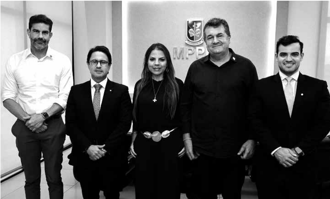
Chefe do Ministério Público estadual e promotores de Justiça foram convocados ao debate por representantes da Famup

mup afirmaram que os critérios para os cachês cobrados pelos cantores e bandas são subjetivos e que os Municípios, em determinadas situações, usam verbas federais (do Ministério do Turismo, por exemplo) destinadas exclusivamente para esse fim, o que não se configuraria como irregularidade em caso de valores mais altos que a realidade econômica e social das cidades em questão.