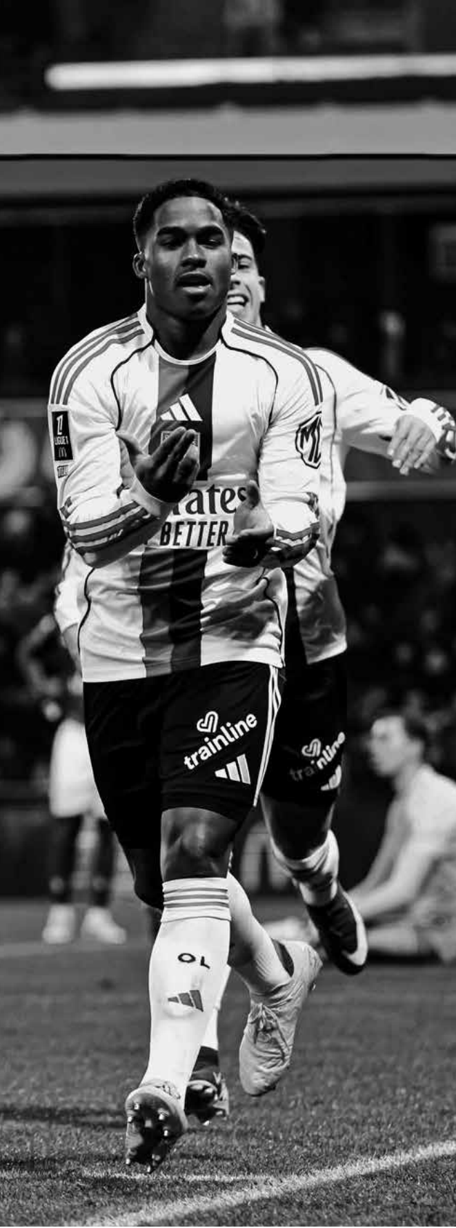
Atacante Endrick segue se destacando no Lyon, da França

Durante a conversa, o empresário também comentou sobre o contexto que levou Endrick a ter poucos minutos no clube espanhol antes do empréstimo, citando a forte concorrência no elenco merengue e o momento da chegada do atacante.