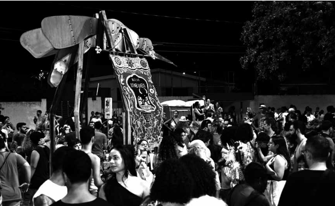
Abram alas que elas vão voar