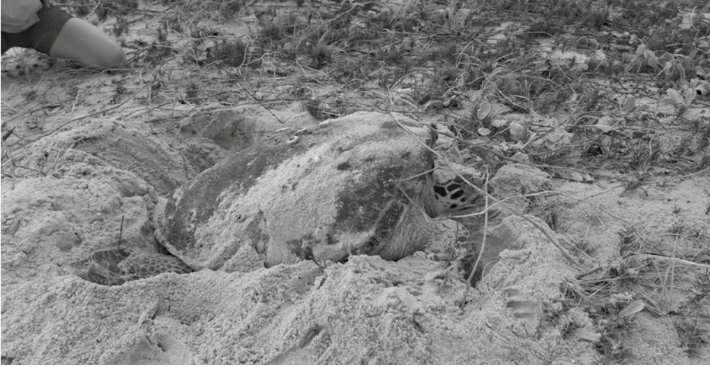
Monitoramento noturno acontecerá nas praias com maior concentração de desovas em JP