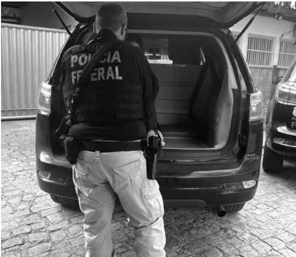
Três acusados foram presos, ontem, em Guarabira

fechado da Caixa foram encaminhados para as autoridades policiais pela Central de Monitoramento de Segurança da empresa. Além de imagens registradas na agência de Tibiri, cenas de uma ação criminosa em uma unidade do Besa, na capital, demonstraram como operava o grupo: após aplicar o mecanismo fraudulento nos terminais, integrantes da quadrilha abordavam as vítimas para oferecer ajuda com o aparente problema de retenção e, em vez disso, distraíam-nas, buscando obter dados pessoais e senhas, enquanto outros comparsas subtraíam os cartões presos nas máquinas — com os quais realizavam saques e transferências indevidas.