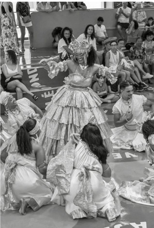
Cortejo de Oxalá: bloco embalado pelos cantos ancestrais