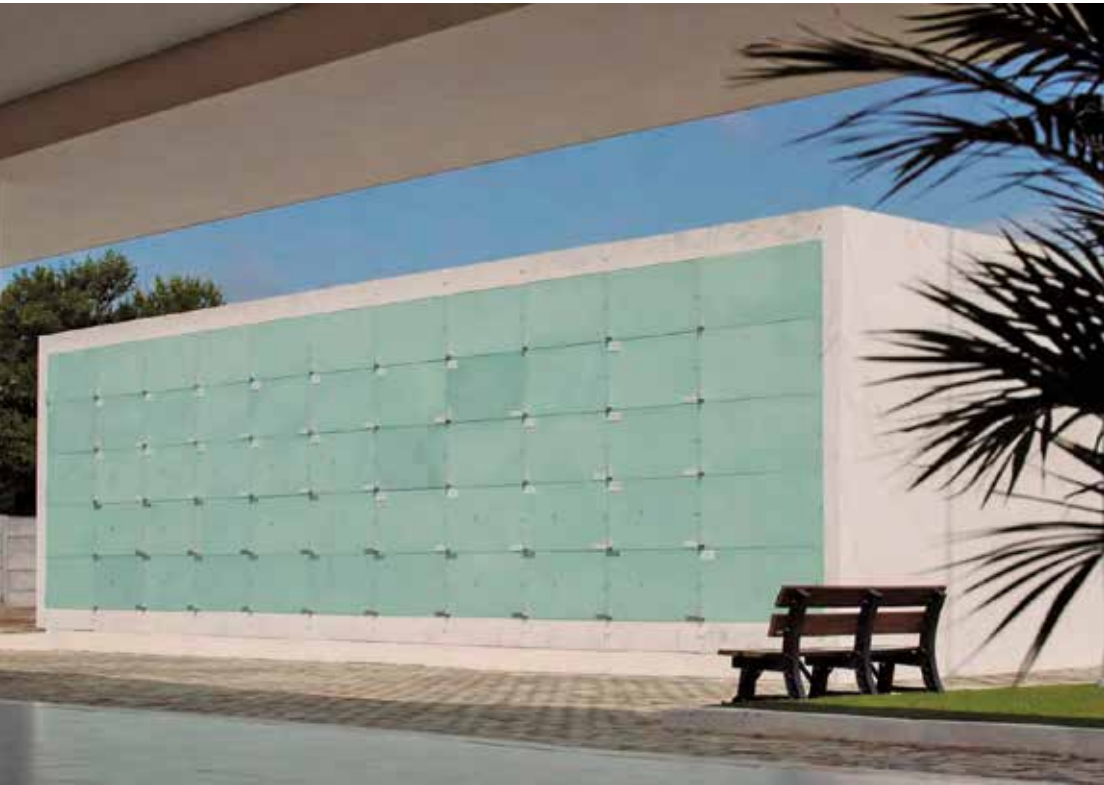
Na Paraíba, o município de Guarabira abriga um dos primeiros mausolés verticais do estado

“Muitos cemitérios já operam no limite da capacidade ou enfrentam processos complexos para novos sepultamentos. A ausência de planejamento adequado pode gerar impactos operacionais e ambientais, especialmente em áreas com infraestrutura antiga ou sem adaptação às condições urbanas atuais”, explica Jarlyson Rocha, gerente comercial do Grupo Morada.