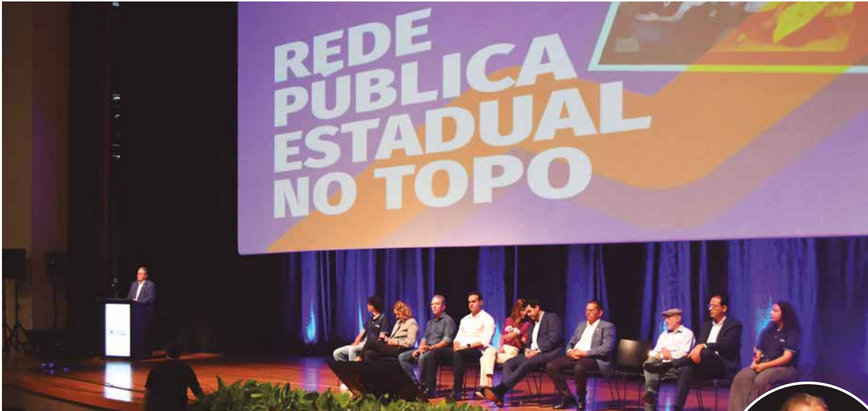
Evento no Teatro Pedra do Reino, em João Pessoa, marcou a abertura do Ano Letivo 2026 da rede estadual de ensino

cebe, compartilha e multiplica com outras pessoas é transformador. Começamos o ano celebrando o Selo Ouro na alfabetização e a maior aprovação proporcional do país no SisU. Programas como o Conexão Mundo mostram que intercâmbio não é privilégio, é política pública para todos. Isso prova que estamos no caminho certo”, afirmou.