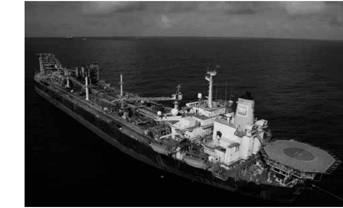
Extração de petróleo impulsionou avanço no Rio de Janeiro