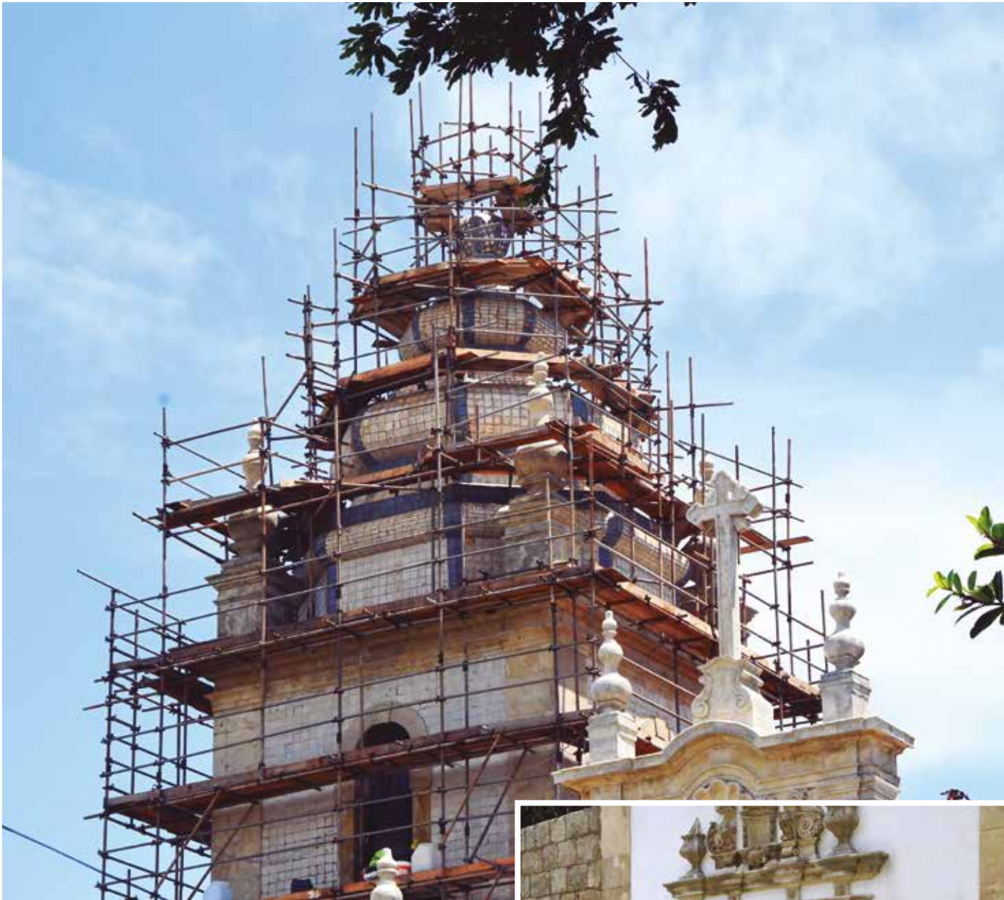
Trabalhos são realizados na torre do Conjunto Franciscano