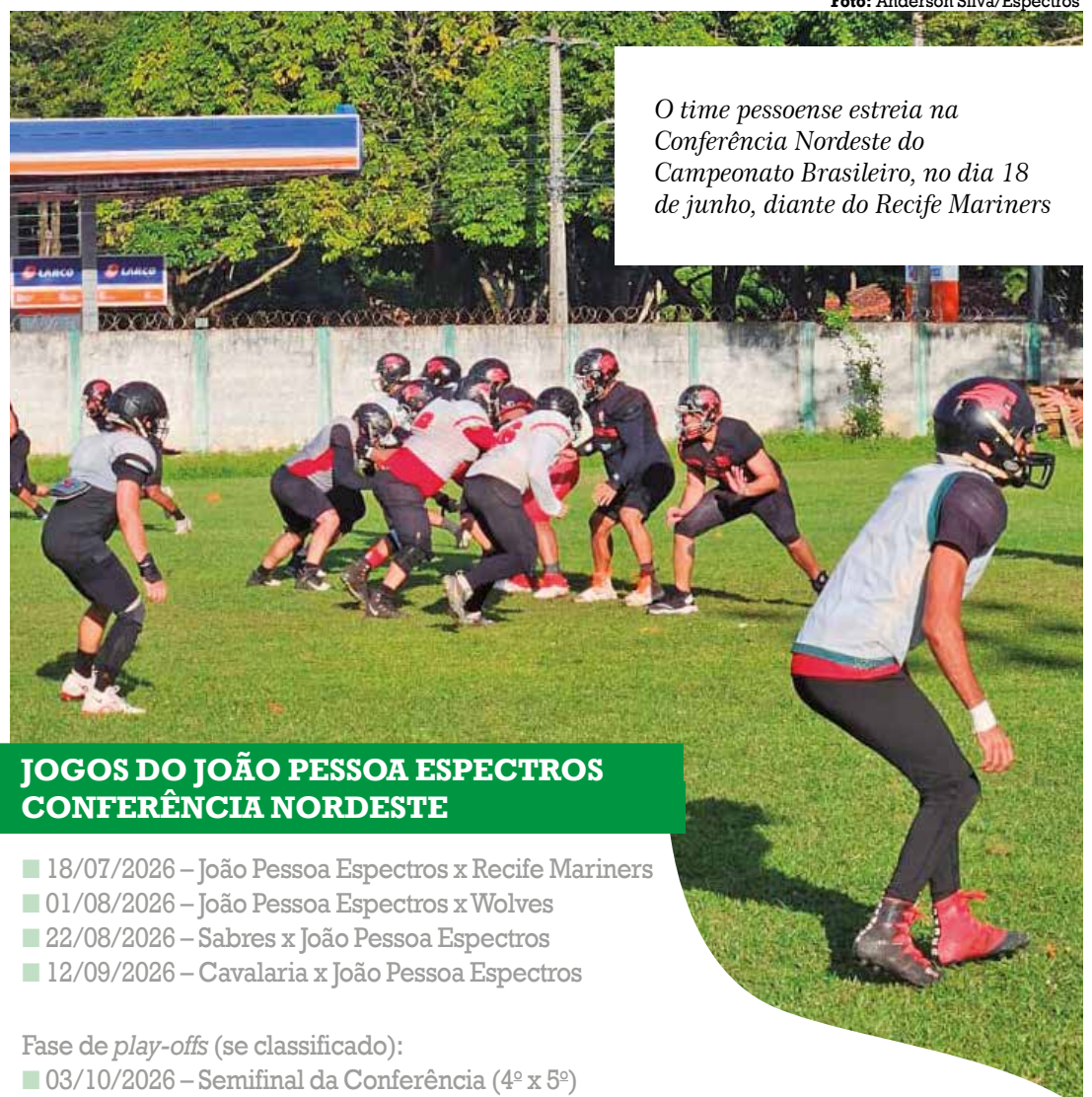
O time pessoense estreia na Conferência Nordeste do Campeonato Brasileiro, no dia 18 de junho, diante do Recife Mariners