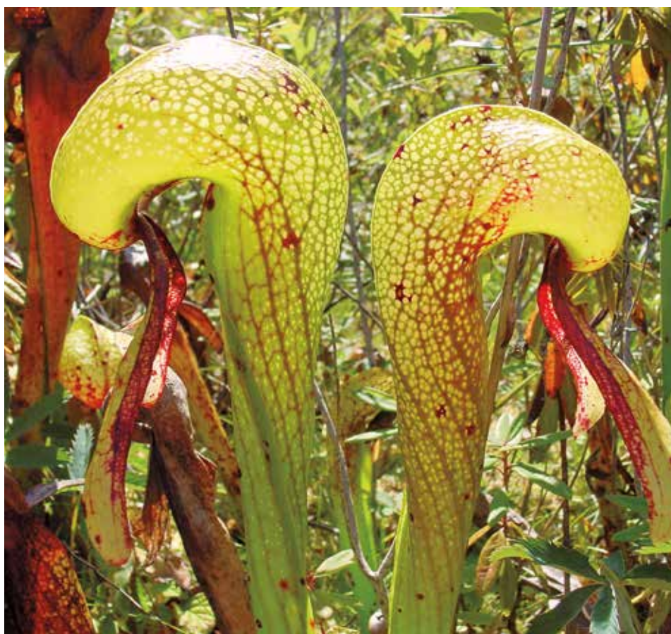
Darlingtonia californica vive em zonas pantanosas e montanhosas californianas

A nova descoberta poderá reforçar a importância ecológica dessa espécie, não apenas como uma predadora, mas como um organismo capaz de estruturar comunidades inteiras em ambientes mais exigentes.