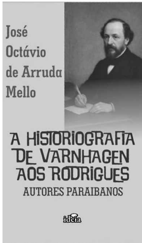
Melo: “texto fluido e diversidade de temas”

do do regime militar**. E como editor-chefe da revista Farpas , em torno da qual reuniu nomes como os de Nelson Werneck Sodré, Otto Maria Carpeaux, Jaguar e muitos outros, não poderia ser diferente: esgrimiou o florete de sua ironia cáustica contra os poderosos de plantão.