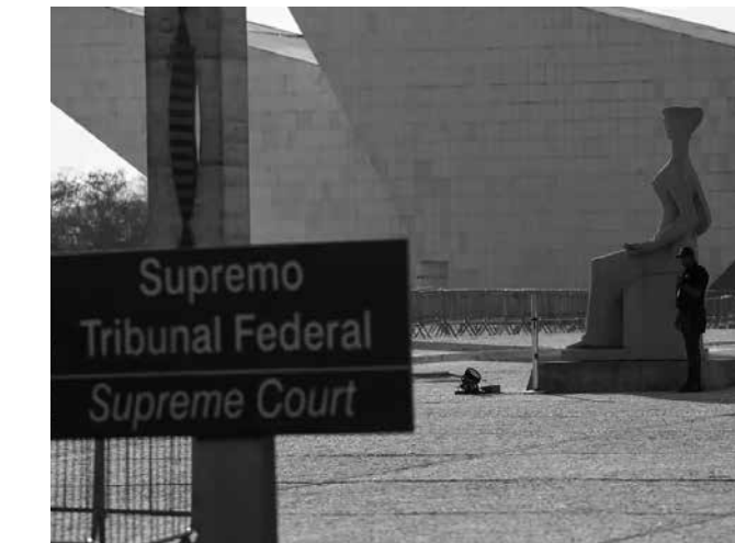
Prevaleceu no julgamento o voto do ministro André Mendonça

Prevaleceu no julgamento o voto do ministro André Mendonça. Segundo o ministro, a reforma da previdência criou uma regra disfuncional e não protege o trabalhador das consequências das atividades nocivas, conforme determina a Constituição. “No que tange à exigência de idade mínima para fruição do benefício da idade mínima para aposentadoria especial, mesmo após a exposição a 15, 20 ou 25 anos a determinado agente nocivo à saúde do trabalhador, está-se