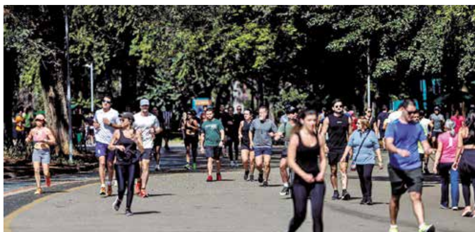
Exercícios físicos, a exemplo da caminhada e em academias, previnem a doença