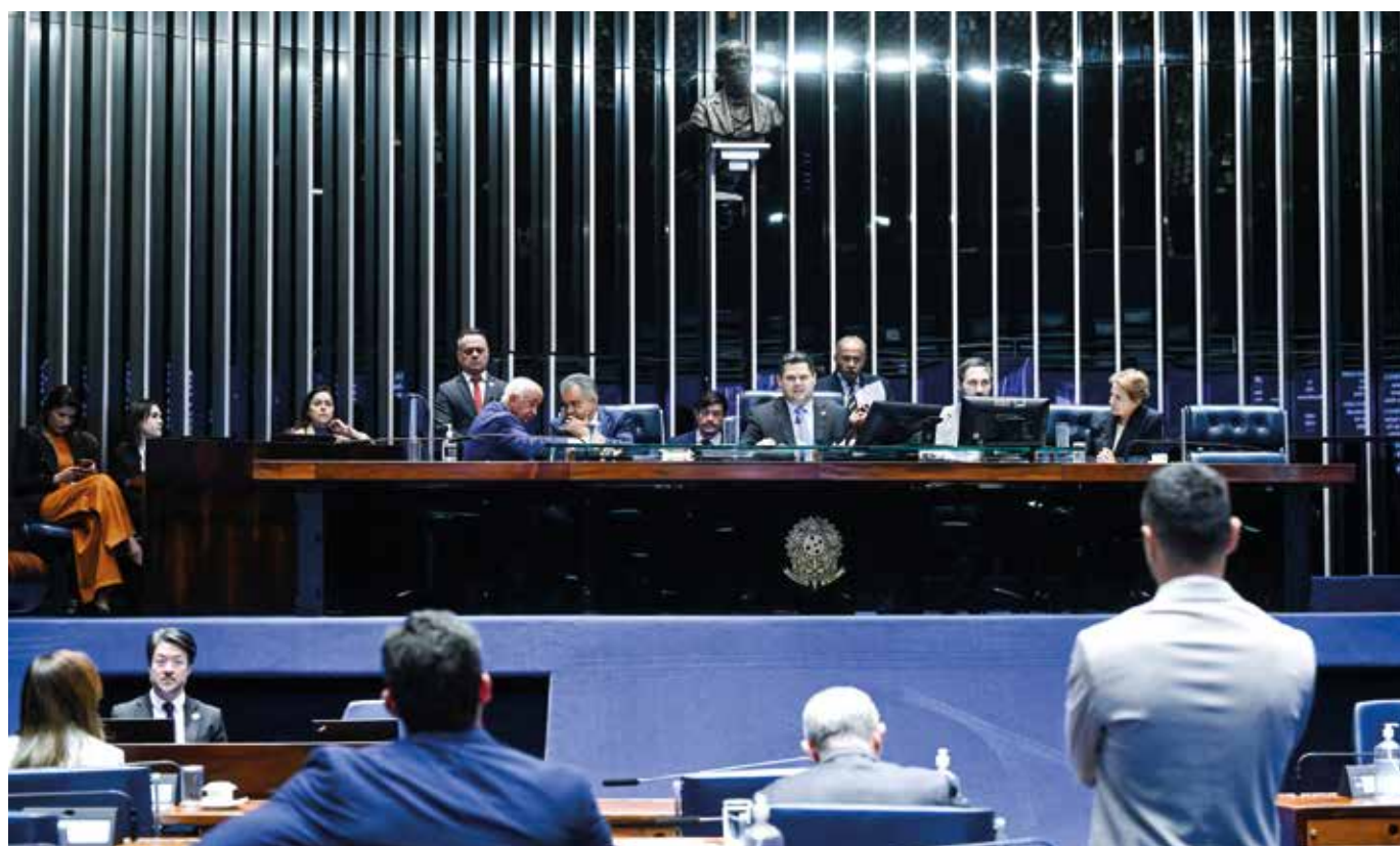
Processo de apreciação e votação simbólica do PDL nº 3/2025, que suspende resolução do Conanda, durou apenas dois minutos

O Conanda integra a estrutura do Ministério dos Direitos Humanos e da Cidadania (MDHC). Na terça-feira, a ministra da pasta, Janine Mello, criticou a aprovação do projeto pelo Senado.