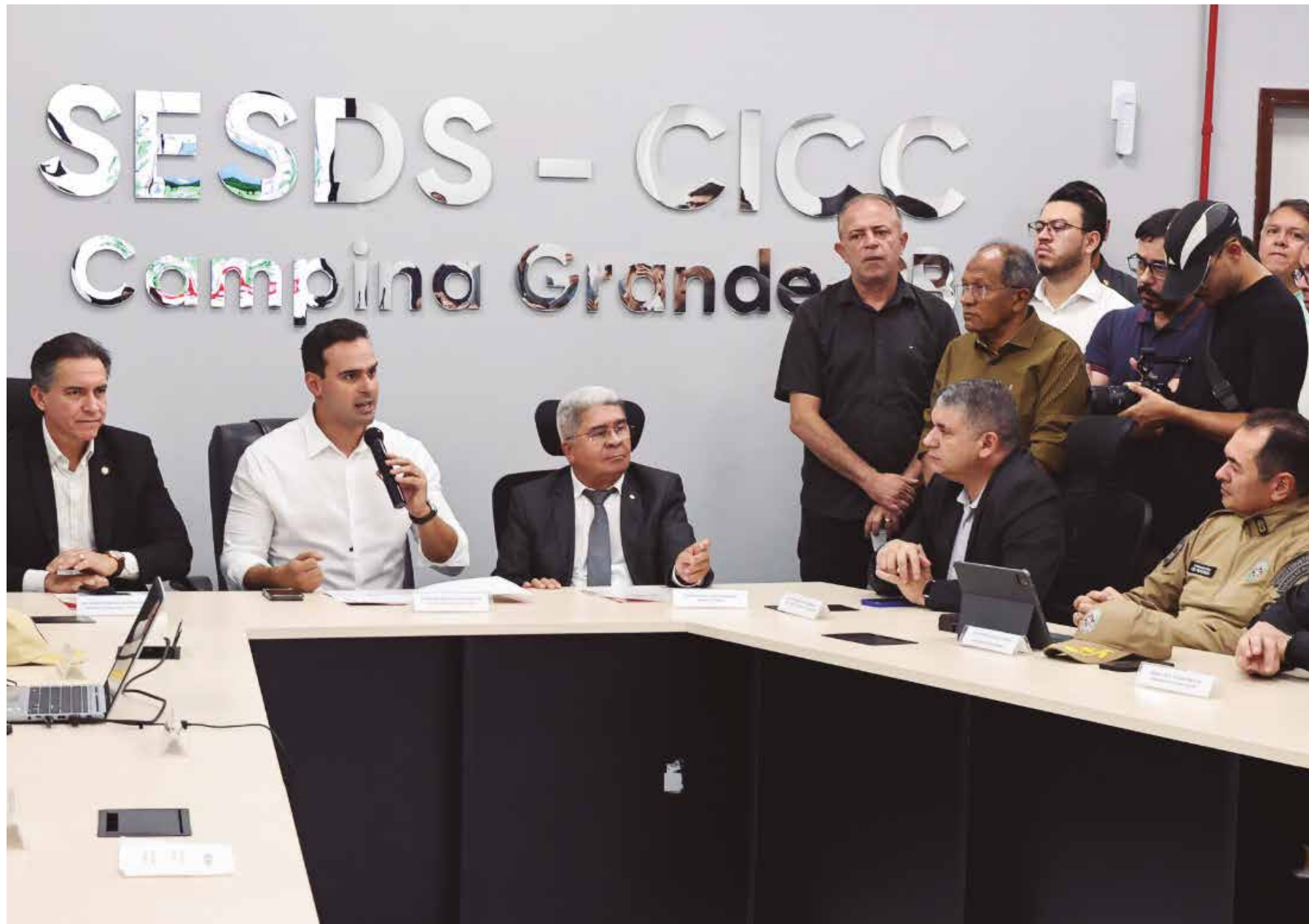
Em reunião no Cicc de Campina Grande, o governador da Paraíba, Lucas Ribeiro, celebrou a diminuição no índice de crimes violentos letais intencionais

O conjunto de tecnologias implantadas pela Paraíba tem despertado interesse de outros estados e consolidado o São João paraibano como referência nacional em inovação aplicada à segurança pública. Somente para Campina Grande, foram destinados R$ 6,3 milhões em ajuda de custo operacional. O efetivo do Cicc será composto por 45 profissionais de segurança de segunda a quarta-feira e 60 profissionais de quinta-feira a domingo, assim como em feriados, períodos de maior concentração de público.