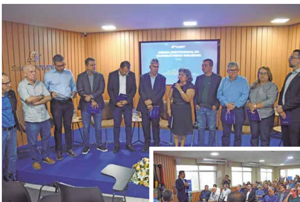
Lançamento reuniu autoridades e representantes do segmento na sede da Organização das Cooperativas Brasileiras

Regionalmente, o Sudeste concentrou o maior volume de empresas inadimplentes em abril de 2026, com destaque para São Paulo (3.076.064), seguido por Minas Gerais (881.652) e Rio de Janeiro (864.722). Na sequência, apareceram estados como Paraná (588.935) e Rio Grande do Sul (518.195).