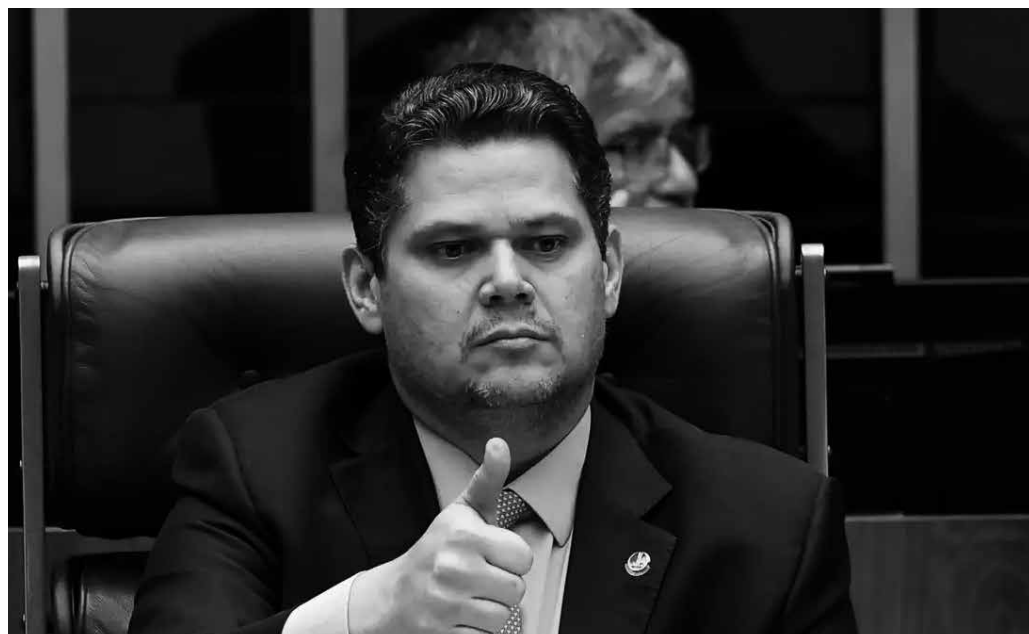
Davi Alcolumbre defendeu que PEC do fim da escala 6x1 seja votada “sem pressa”

Já a oposição apresentou PEC alternativa para manter a jornada de trabalho atual, abrindo possibilidade para contratos por hora trabalhada. O líder da oposição no Sena-