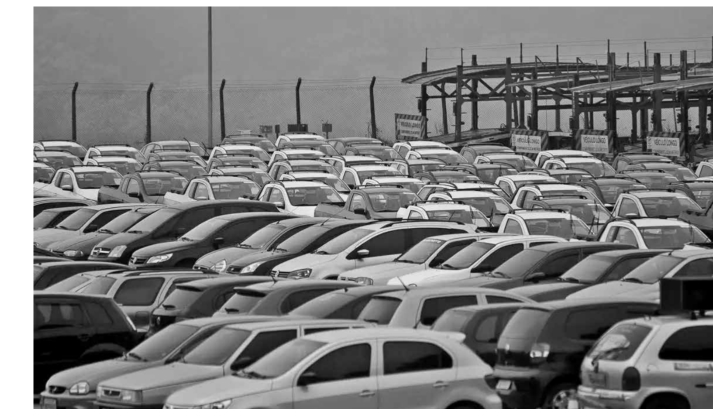
Programas como Carro Sustentável e Move Brasil impulsionaram a trajetória positiva no período, segundo a Fenabreve

Com crescimento de 77,9% nesse comparativo, os auto-