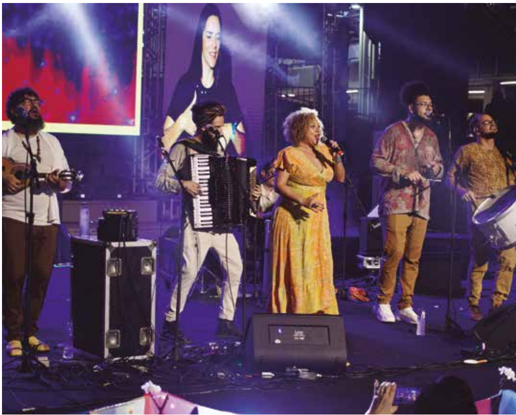
Programa também trará trechos do show de encerramento do evento, ocorrido no dia 30 de maio