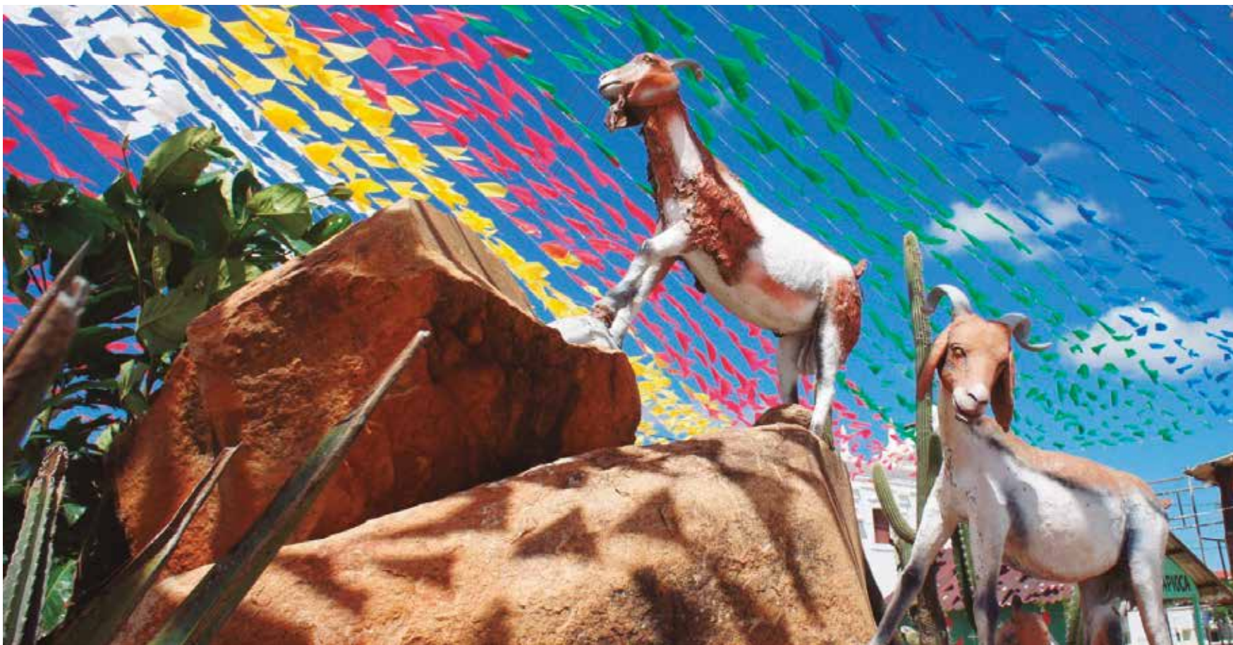
Festa foi organizada para receber turistas e promover negócios, valorizando a cultura nordestina; expectativa é reunir um público de 250 mil pessoas

O evento conta, ainda, com o apoio, entre outros, da Empresa Paraibana de Pesquisa, Extensão Rural e Regularização Fundiária (Empaer-PB), Associação Paraibana dos Criadores de Caprinos, Ovinos e Bovinos (Apacco + Bov), Sistema Nacional de Aprendizagem Rural da Paraíba (Senar-PB), e Federação da Agricultura da Paraíba (Faepa-PB).