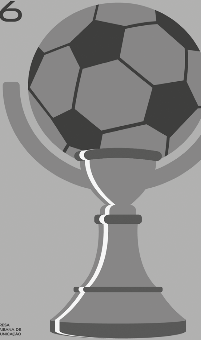
TABELA DA COPA 2026