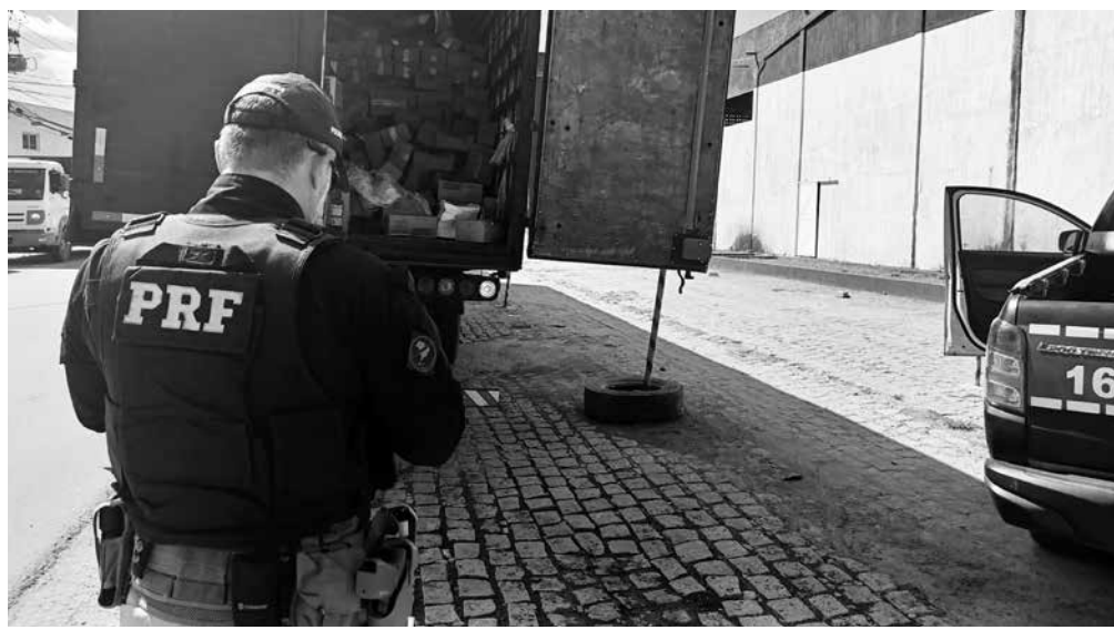
Criminosos simulavam assaltos para acionar o seguro, segundo investigação da PRF

Ao avistarem as equipes da PRF, os dois ocupantes do automóvel de apoio fugiram a pé em direção à vegetação, abandonando o carro às margens da rodovia. No interior do veículo deixado para trás,