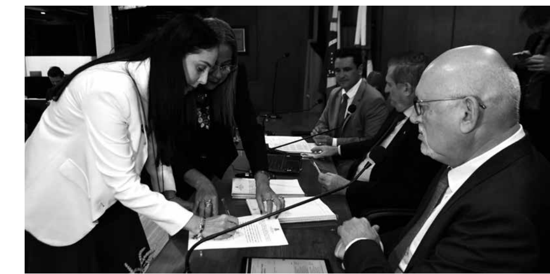
Parlamentar (E) já havia exercido mandato na Casa Napoleão Laureano, há quatro anos

“Vamos visitar os 64 bairros de João Pessoa, trazendo ideias para mudar e transformar a nossa cidade. Vamos fazer um mandato participativo, no qual a população estará presente, porque esta é a Casa do Povo. Renovo meu compromisso de trabalhar com dedicação, responsabilidade, transparência e amor ao próximo. Acredito que a política