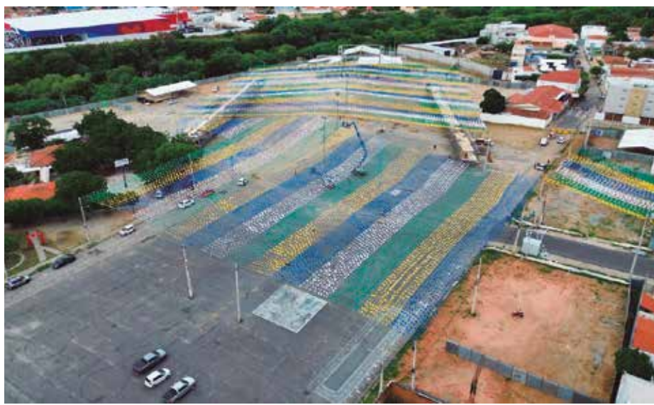
Palco terá 1.000 m 2 de área; capacidade do público no Terreiro é de 80 mil pessoas

As apresentações acontecerão em um palco de 1.000 m 2 , preparado para acolher todas as atrações. “O esqueleto de palco já