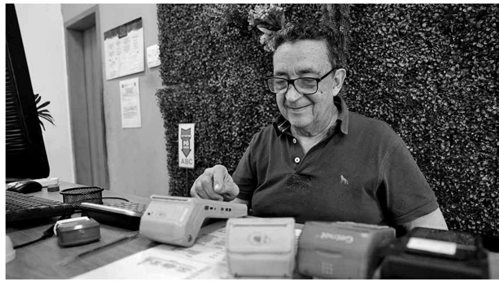
Reforma da Previdência pode ter influenciado aumento da participação de idosos no mercado

Sob o argumento de equilibrar as contas da Previdência, a reforma passou a exigir das mulheres, pelo menos, 62