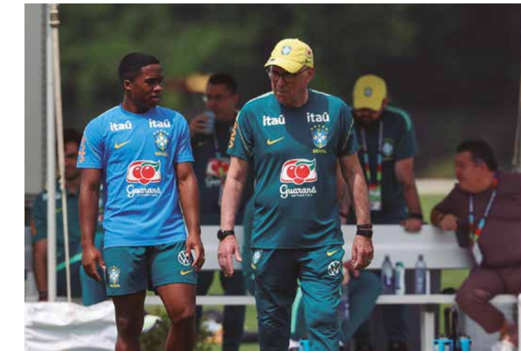
Endrick em conversa descontraída com o técnico Carlo Ancelotti, após o treino da Seleção

mericana, Igor Thiago, Endrick, Lucas Paquetá e Rayan deixaram uma impressão melhor do que os teóricos titulares e, de um 2 a 1 no intervalo, com o suposto "onze inicial", a Canarinho passou para o 6 a 2 definitivo com os reservas.