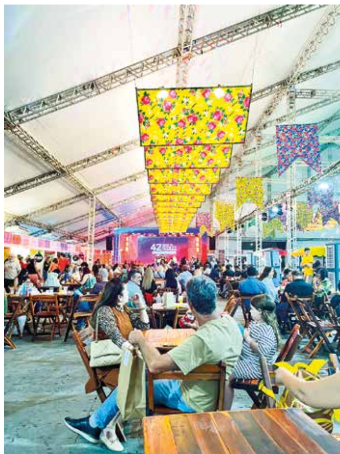
Salão acontecerá até o dia 4 de julho, das 15h às 22h

“Este é o momento de colher os resultados de um trabalho realizado ao longo de todo o ano. É uma ocasião de celebração e de abrir as portas para um período de