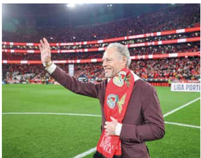
Michel Preud'homme elenca os favoritos ao título

No entanto, alertou que fazer prognósticos em uma