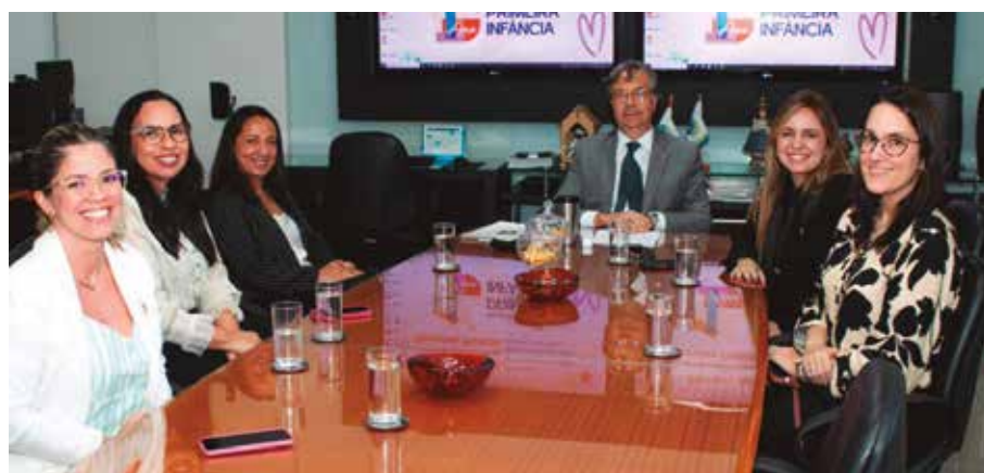
Cinco mulheres foram designadas para representar a Corte de Contas na iniciativa