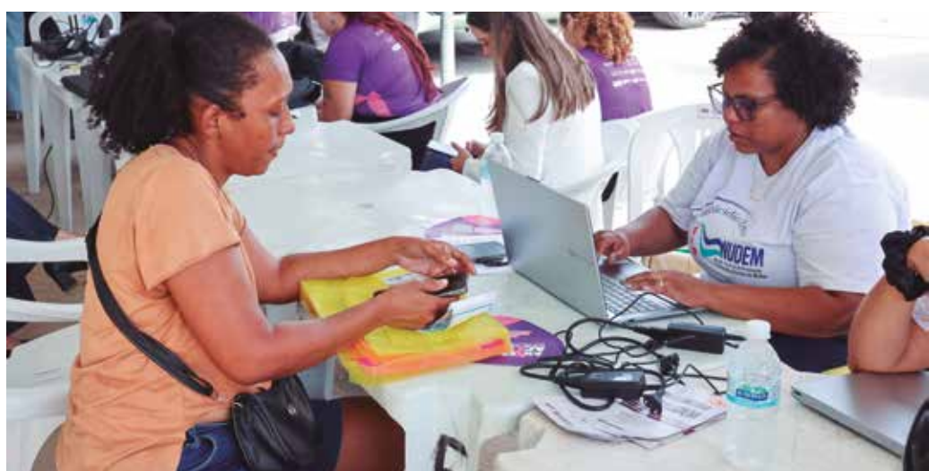
Núcleos da Defensoria Pública realizaram ação de cidadania na comunidade Costa do Sol