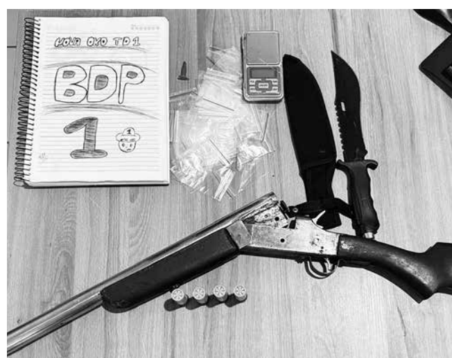
Entre os objetos apreendidos, estava uma arma de fogo

As diligências aconteceram na residência do ex-companheiro da vítima e resultaram na apreensão de uma arma de fogo, uma arma branca, instrumentos comumente utilizados na prática do tráfico de drogas, como balança de precisão e papéletes para acondicionamento de entorpecentes, além de um caderno contendo símbolos associados à facção criminosa com atuação no estado. Para a delegada, a apreensão