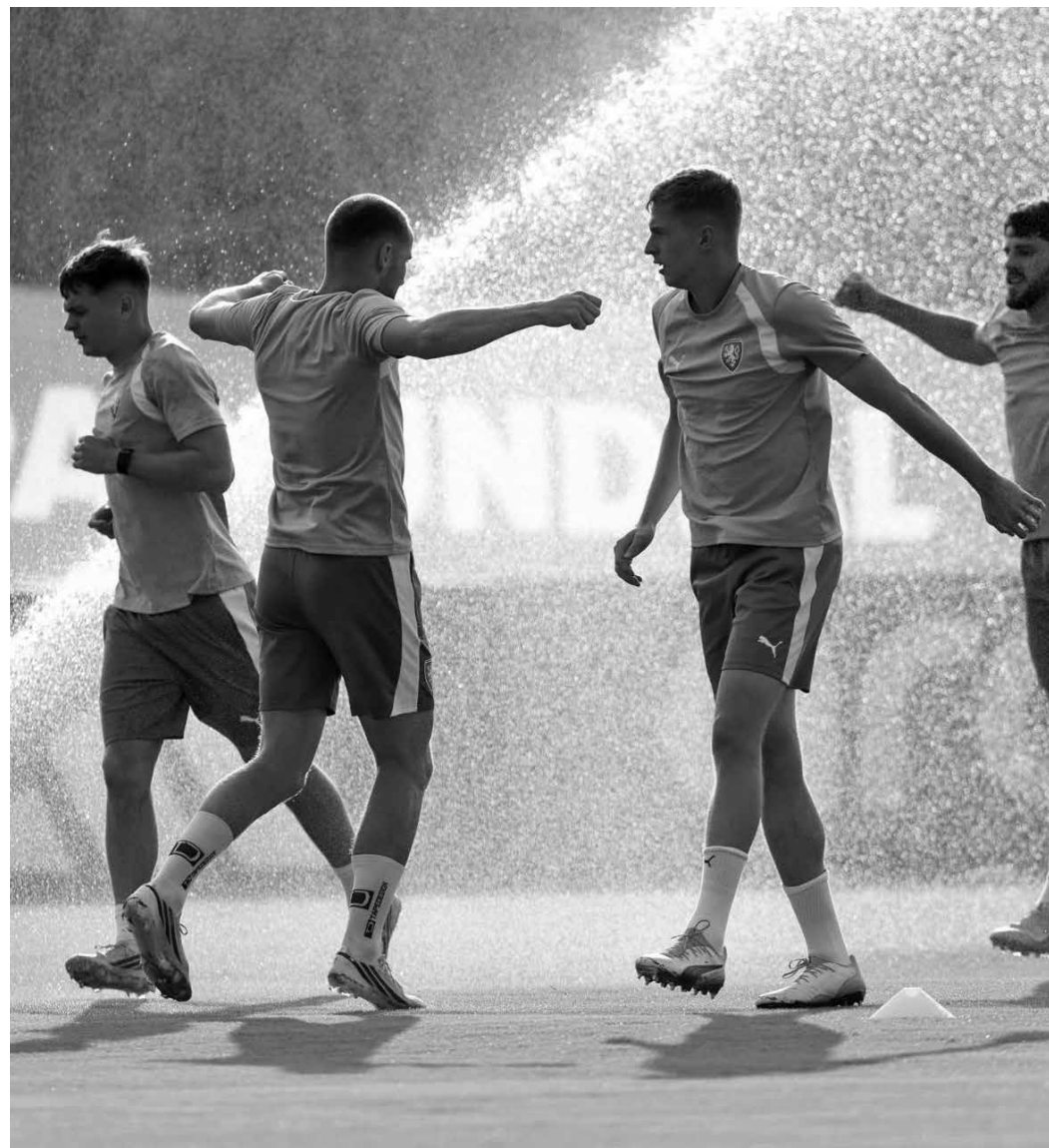
Jogadores da República Theca recebendo jatos de água durante o intervalo de treino

Haverá seleções para as quais a adaptação inicial poderá ser mais difícil, apon-