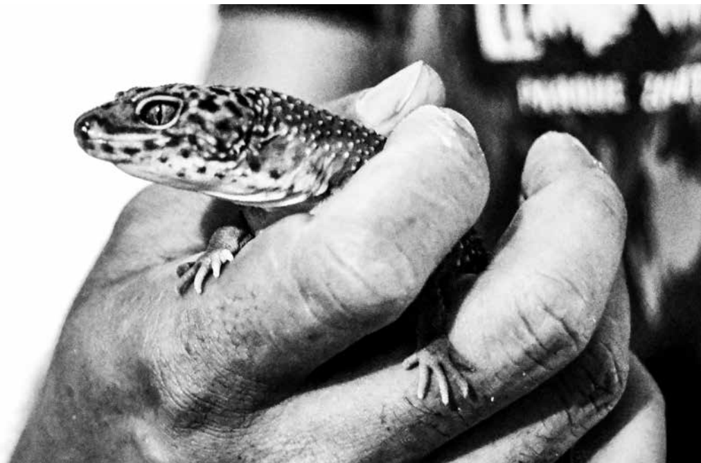
Amigo de outra espécie