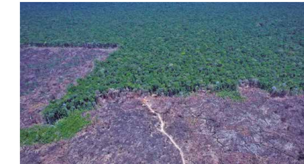
Desflorestamento vem do avanço da fronteira agrícola, da pecuária e do garimpo, que também polui

No caso do Cerrado, 73,4% do desmatamento ocorreu em propriedades privadas já regularizadas. Nesse bioma, 65% das áreas podem ser desmatadas, ou