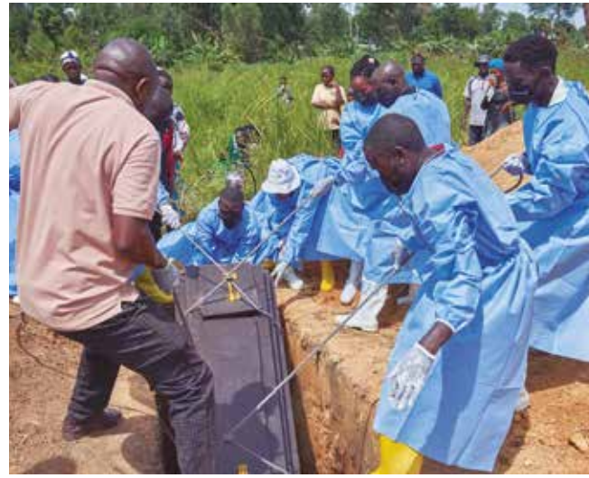
País já confirmou 635 pessoas infectadas e 127 mortes

que os profissionais de saúde que trabalham nas 27 áreas afetadas, distribuídas entre as províncias de Ituri — o