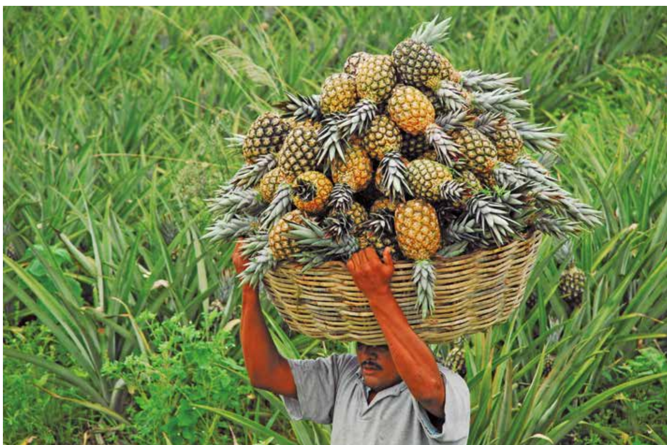
Abacaxi cultivado em municípios paraibanos abastece a produção do concentrado enviado para os Estados Unidos