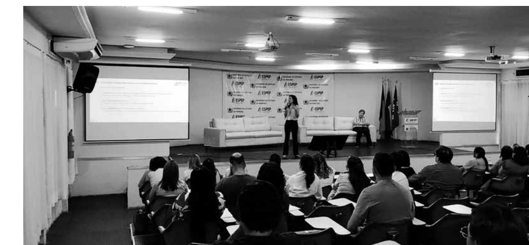
Objetivo é trazer visibilidade às doenças provocadas por fungos, facilitando o diagnóstico