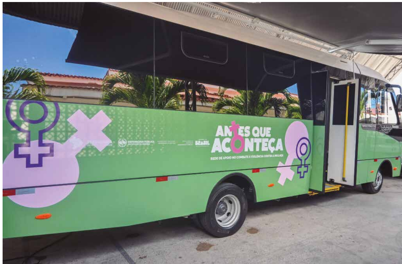
Veículo levará atendimento jurídico e psicossocial a pessoas em situação de vulnerabilidade social na Grande João Pessoa

Mais do que um veículo, a unidade móvel representa a possibilidade de chegar antes que o medo se transforme em silêncio e antes que a violência deixe marcas ainda mais profundas. Para muitas mulheres, ela pode significar o primeiro passo rumo à proteção, à autonomia e ao recomeço.