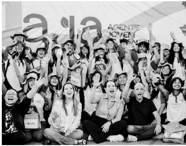
Proposta é promover a cidadania e educação ambiental

O Governo da Paraíba, por meio da Secretaria de Estado do Meio Ambiente e Sustentabilidade (Semas), prorrogou, até o próximo sábado (13), as inscrições para o Programa Agente Jovem Ambiental (AJA) 2026. A iniciativa tem como objetivo promover a educação ambiental, a cidadania e o protagonismo juvenil em todo o estado.