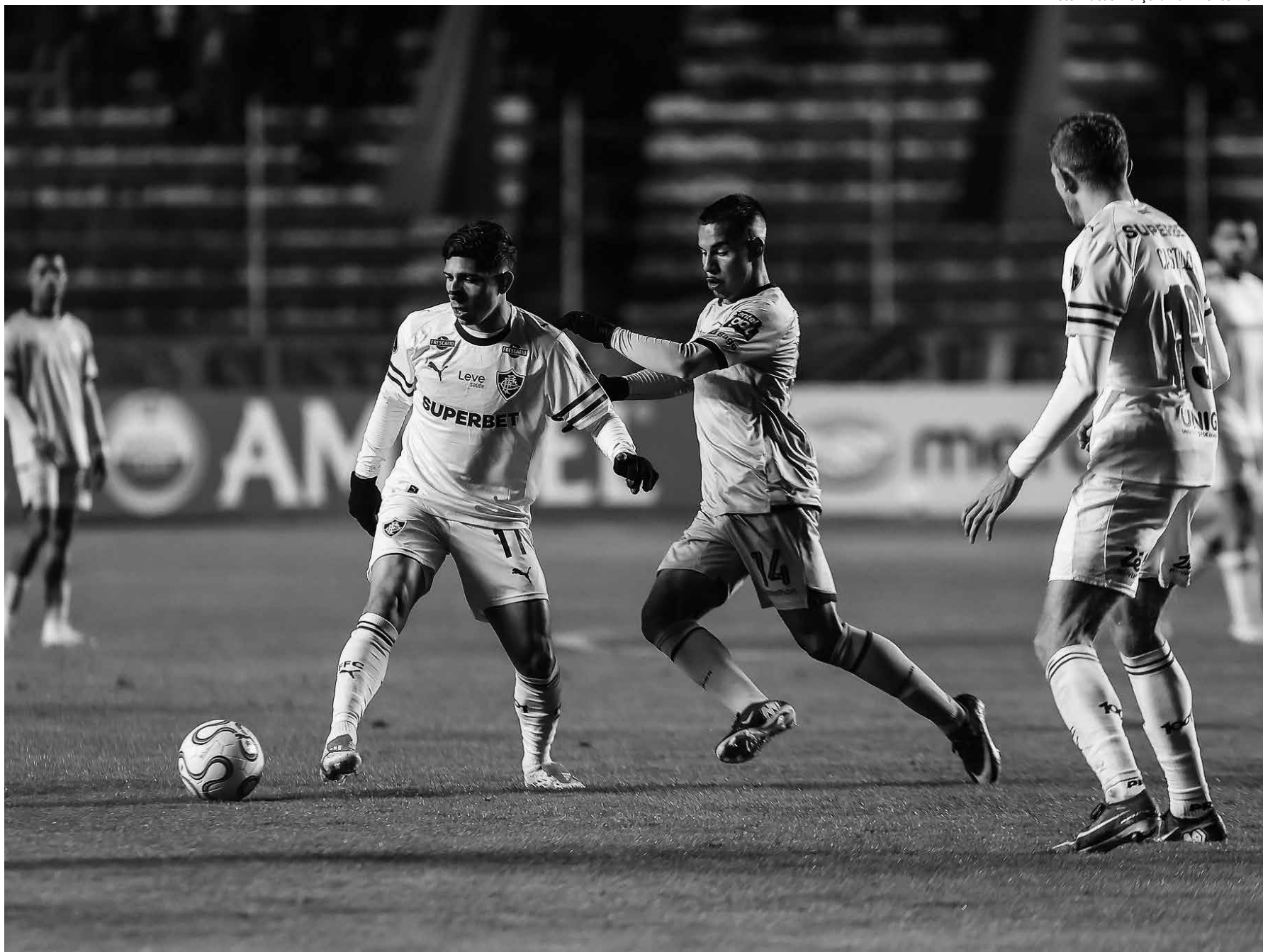
Depois de perder para o Bolívar por 2 a 0, o Fluminense busca a reabilitação e a sobrevivência na Sul-Americana, hoje, contra o Independiente Rivadavia

Do outro lado, o Santa Fe está pressionado. Com