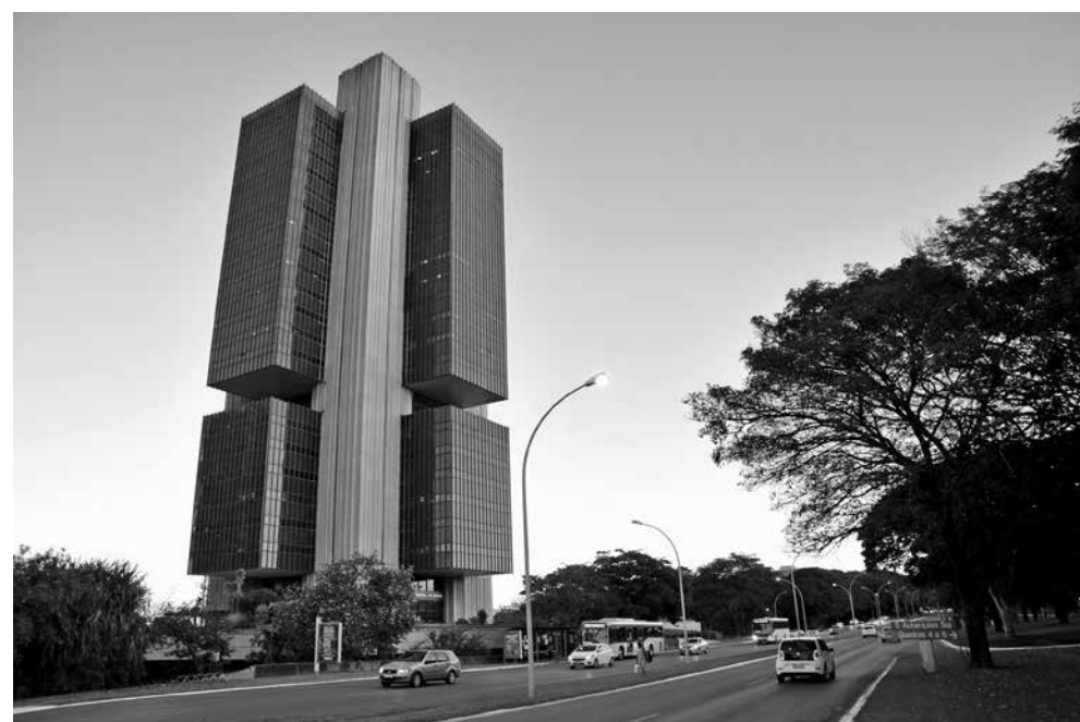
Comitê do Banco Central evitou dar pistas sobre a evolução dos juros nos próximos meses

A taxa básica de juros serve de referência para as demais taxas da economia e é o principal instrumento do Banco Central para manter a infla-