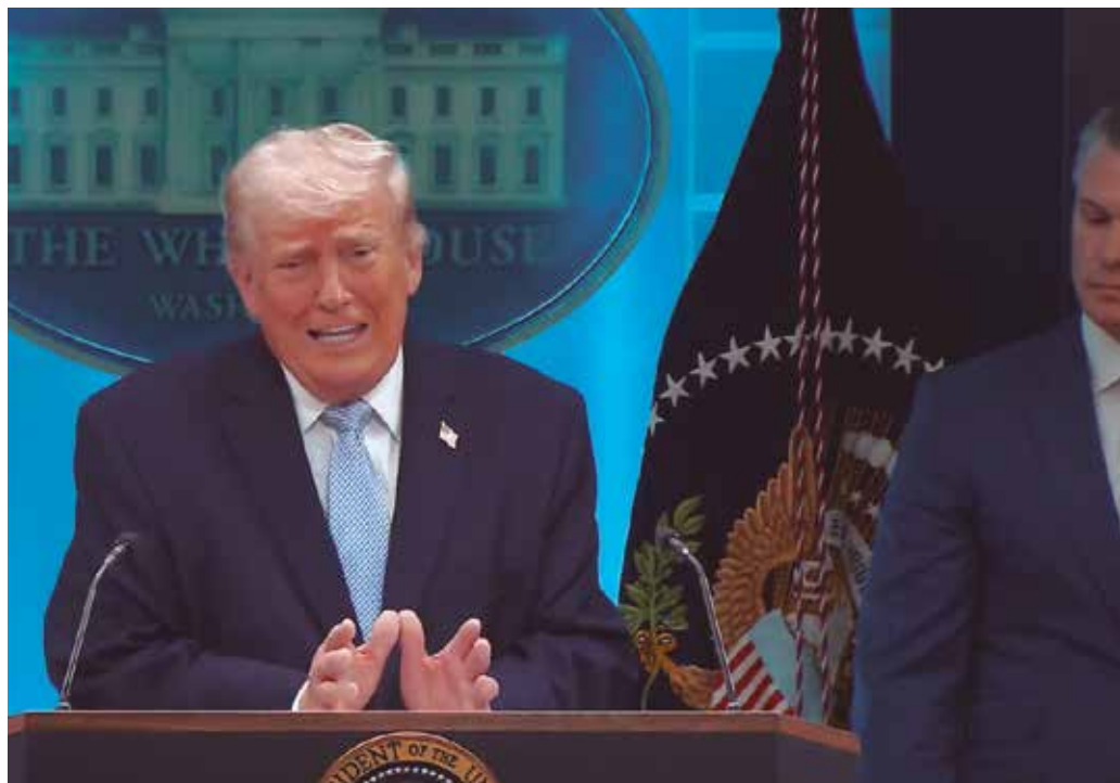
Presidente estadunidense ataca o papa Leão XIV em novas declarações sem provas

“O papa prefere dizer que é bom que o Irã tenha uma arma nuclear. Não acho que isso seja bom. Acho que ele está colocando em risco muitos católicos e muitas pessoas”, disse o magnata durante uma en-