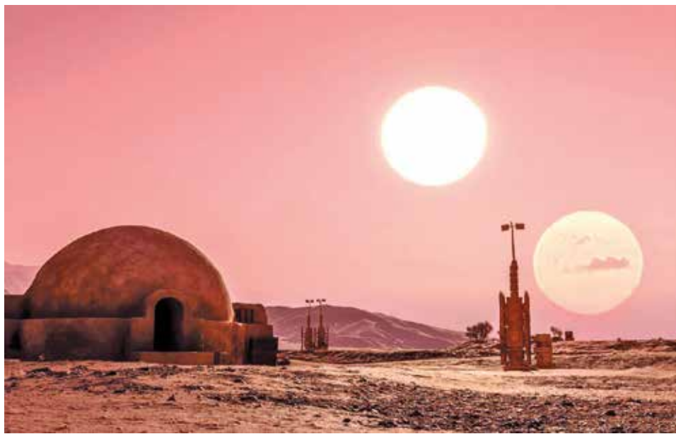
Fenômeno é o que acontece no fictício planeta deserto Tatooine, da franquia Star Wars

“Um monte de coisas que foram previstas na arte e/ou em conceitos artísticos de como o Universo deveria ser se revelaram descobertas científicas”, disse.