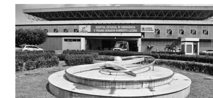
Decisões mais eficientes reduziram tempo de permanência

“É uma forma organizada de identificar fatores que impactam a assistência. Com o Huddle, essas demandas ganham visibilidade e podem ser