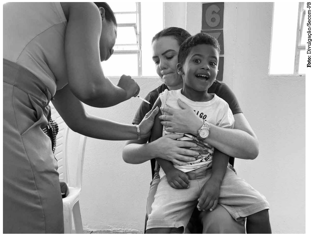
Equipes da Secretaria de Estado de Saúde visitarão escolas em sete municípios paraibanos

■ Iniciativa também visa imunizar pessoas de 15 a 19 anos que ainda não tomaram a primeira dose contra o vírus do HPV