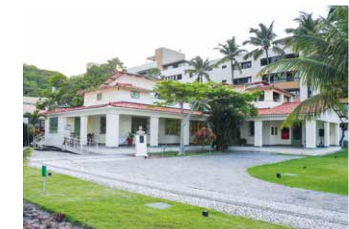
Sede da fundação fica localizada na Avenida Cabo Branco

“Salvaguardar o legado de um homem das letras e da história. Essa é a principal missão da Fundação Casa de José Américo. Guardiã da memória, da tradição, do valor, do exemplo, da influência, da contribuição, da marca, do saber, da cultura, da lição, dos princípios e do conhecimen-