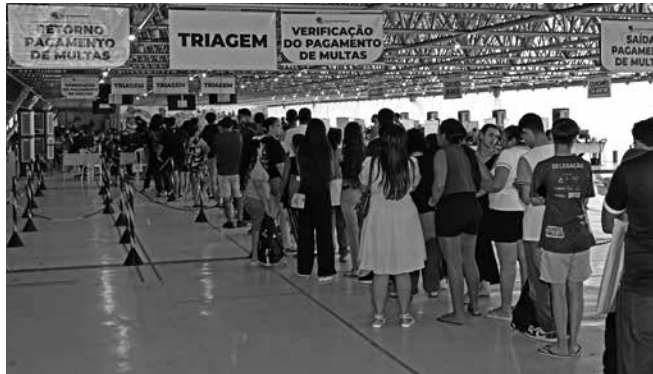
Movimento no Espaço Cultural ficou intenso nos últimos dias

Cidadãos podem tirar dúvidas ou consultar a situação eleitoral pelo canal oficial do TRE-PB no WhatsApp, pelo número (83) 3512-1500.