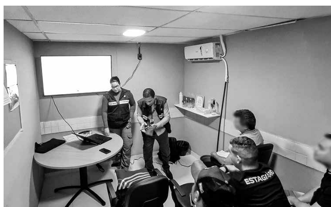
Liberação de bens apreendidos depende de participação

A autarquia oferece o curso uma vez por semestre e as informações para inscrição são disponibilizadas no site da Sudema e no perfil de Instagram @sudemagovpb. A próxima edição do curso já tem data para acontecer: infratores inscritos participarão das aulas hoje e amanhã, no auditório da superintendência, em João Pessoa.