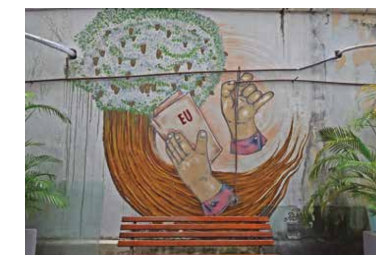
Caleidoscópio de cores e desenhos nos muros e painéis espalhados pelos bairros e ruas da capital encanta pessoenses

“O graffiti é uma grande ferramenta de comunicação, de transformação de territórios, de mudança de ambiente. Quando uma área é grafitada, quando ela é trabalhada com arte, ela se torna uma outra coisa para as pessoas. Não só porque fica mais bonito, mais colorido, mas também porque ela se torna um ambiente mais acolhedor. Isso é uma coisa universal do graffiti, que é desenvolvido no mundo inteiro, e é o objetivo principal dessa expressão artística. Ela surge com esse intento de ressignificar espaços, de recondicionar a visão dos territórios. É uma arte periférica que surge em áreas vulneráveis, feita por pessoas que querem se projetar e se destacar de alguma maneira, trazendo uma perspectiva artísti-