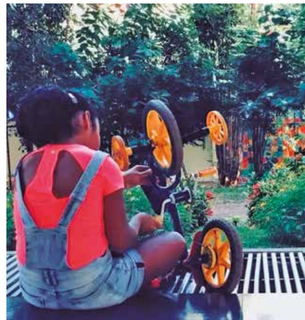
Adoção no Brasil passa pela Vara da Infância e Juventude

O órgão especial, formado pelos desembargadores mais antigos, ao conceder a medida liminar, “reconheceu a plausibilidade jurídica do pedido e o perigo na demora, destacando o risco à proteção integral de crianças e adolescentes e a possibilidade de danos continuados e de difícil reversão ao erário, em razão da aplicação de norma potencialmente inconstitucional”. A decisão, inicialmente proferida de forma monocrática, em razão da urgência, foi posteriormente referendada por unanimidade pelo colegiado.