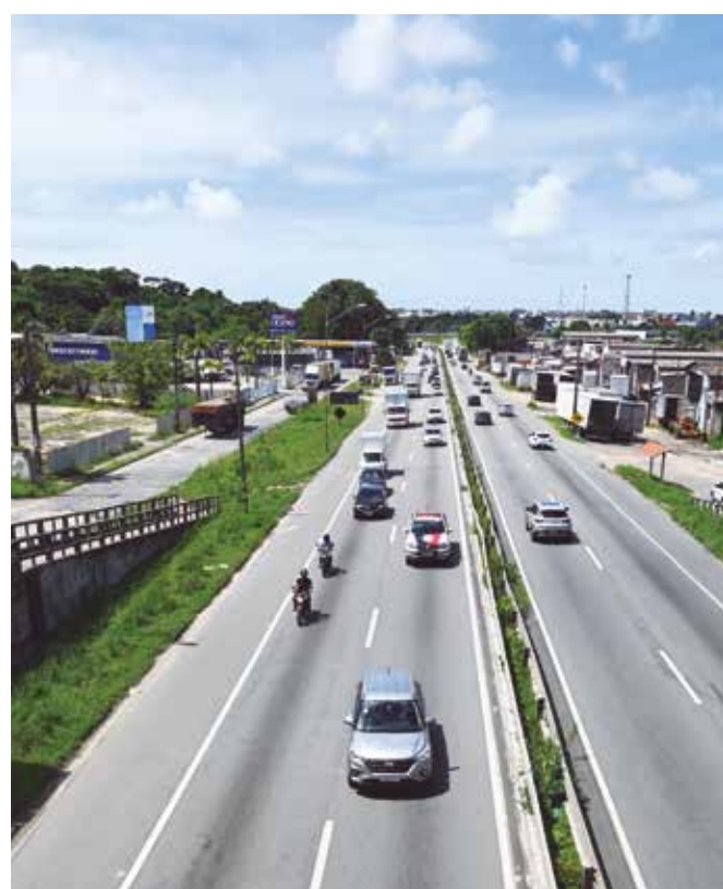
Ações do órgão contemplarão 20 municípios da Paraíba

O Movimento Maio Amarelo surgiu após a Assembleia-Geral das Nações Unidas rea-