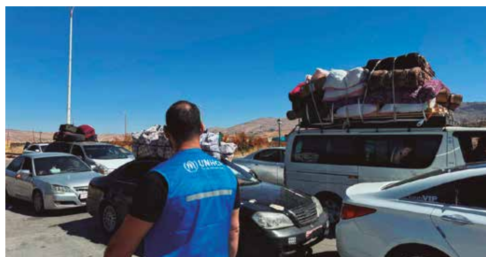
Ataques de Israel contra o Líbano desde o cessar-fogo causaram cerca de 400 mortos

O Ministério da Saúde libanês informou que 2.701 pessoas morreram e 8.311 ficaram feridas devido aos bombardeios de Israel desde 2 de março, em um novo balanço divulgado ontem.