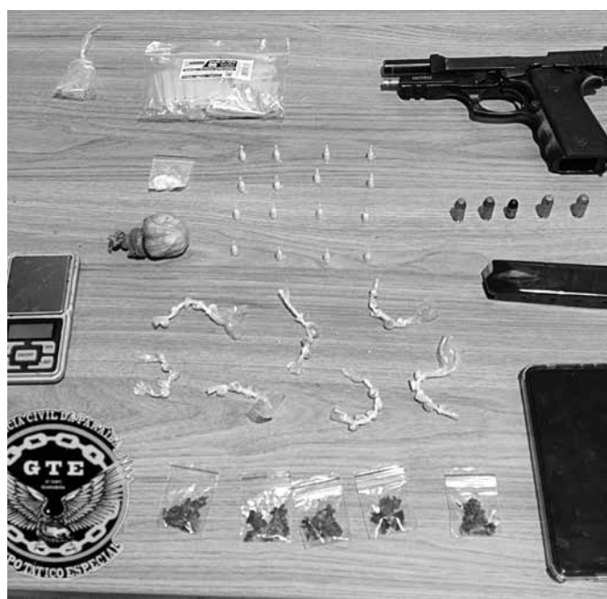
Suspeito possuía, ilegalmente, arma de fogo de uso restrito

As investigações também revelaram que o suspeito já possui diversas passagens pela polícia. O homem foi autuado em flagrante e conduzido à unidade policial para a adoção das medidas cabíveis, permanecendo à disposição da Justiça.