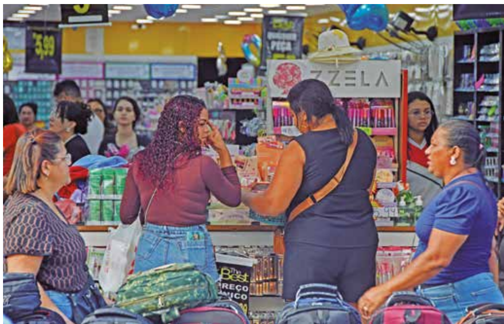
Paraibanos cadastrados concorrem a 30 prêmios de R$ 2,5 mil e um de R$ 25 mil

gãos como Companhia de Processamento de Dados da Paraíba (Codata) e a Lotep, incentiva o cidadão paraibano a desenvolver o exercício da cidadania ao exigir a nota fiscal ao incluir o CPF na Nota Fiscal do Consumidor Eletrônica (NFC-e) de suas compras no comércio do Estado da Paraíba. A campanha também tem como objetivo fortalecer o comércio local nos 223 municípios.