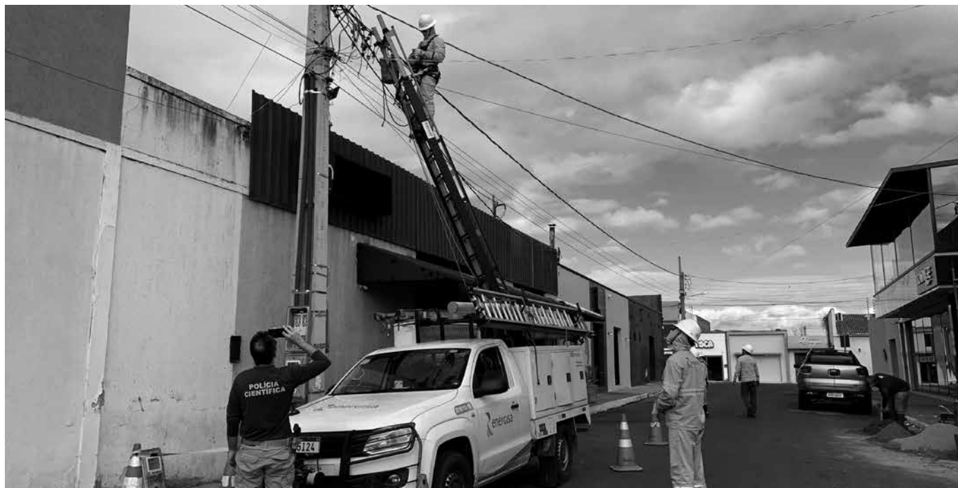
Fiscalização é realizada pela Energisa, em parceria com órgãos de segurança; em 2025, houve 175 prisões ligadas ao crime

Com o intuito de identificar irregularidades na rede elétrica, a fiscalização da Energisa é feita com frequência. Para tanto, a colaboração da população é essencial. Ligações clandestinas e fraudes podem ser denunciadas, de forma anônima, pelo telefone 0800 083 0196, pelo WhatsApp (83) 9135-5540 ou pelo aplicativo Energisa On.