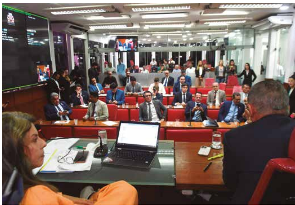
Programa sugere a criação de pontos de coleta em locais estratégicos da capital paraibana