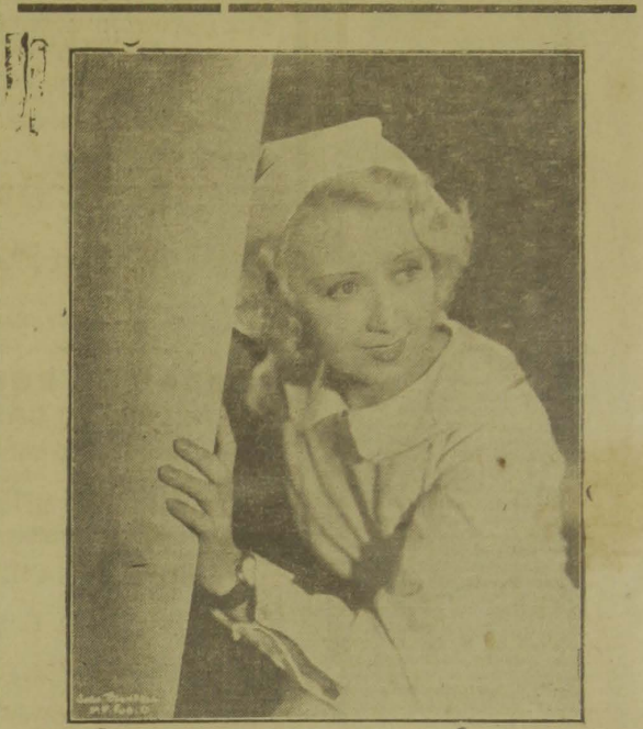
Joan Blondell, a linda e insinuante estrela de "Erros do Coração", que o "Rio Branco" exhibirá hoje, na "Sessão das Moças".